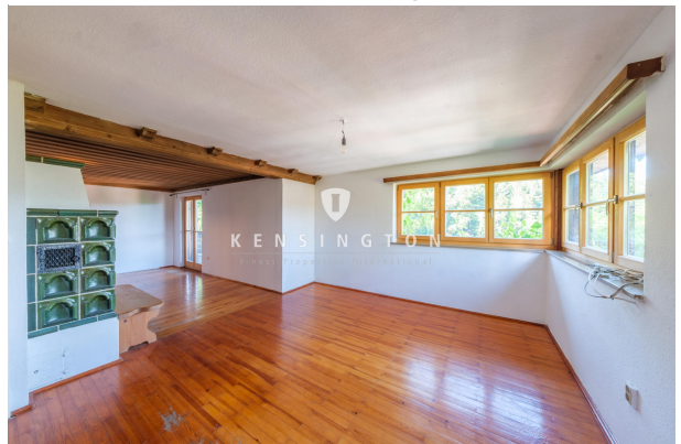
Wohnbereich von der Küche aus gesehen