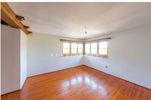
Wohnbereich mit Seeblick