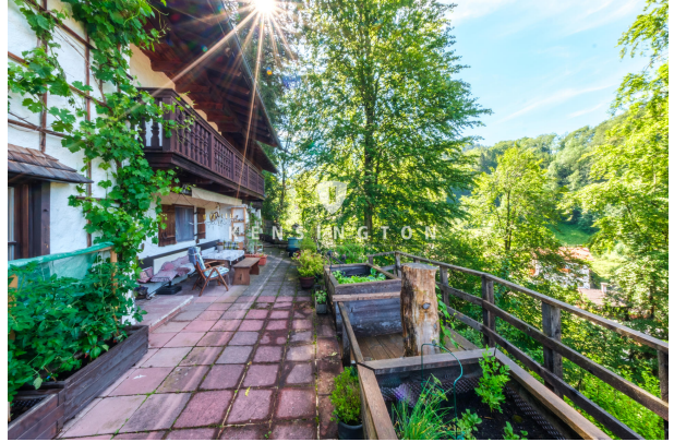
Terrasse mit Blickrichtung zum Berg