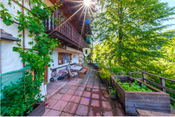
Terrasse Blickrichtung Osten