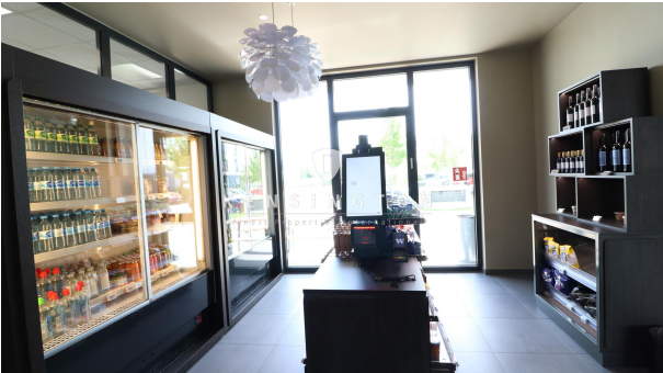
Kleiner Frühstücksraum/ Tagungsraum