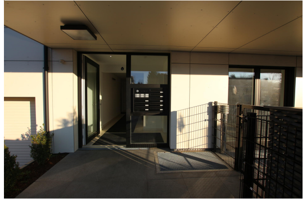
Terrasse zur Straße