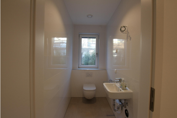
WC 2 EG