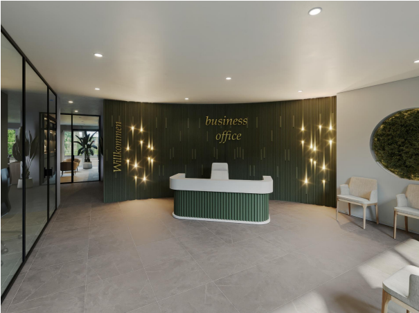
Renderingfoto 2 - Erdgeschoss