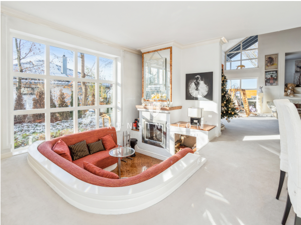
Kaminlounge der Extraklasse