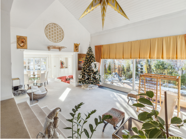
Luftig & Hell