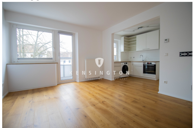
Großzügig & freundlich