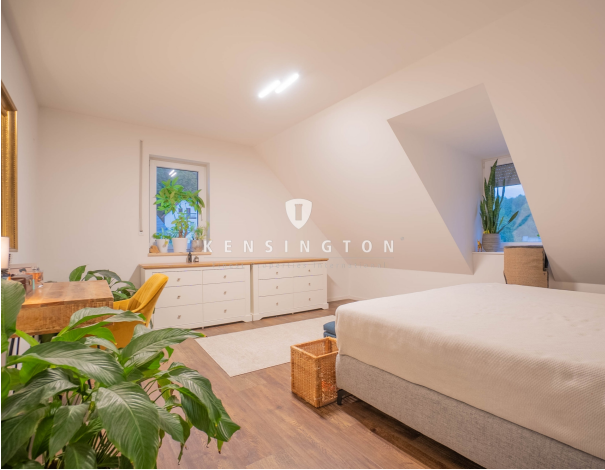
Geschmackvoll & weitläufig!