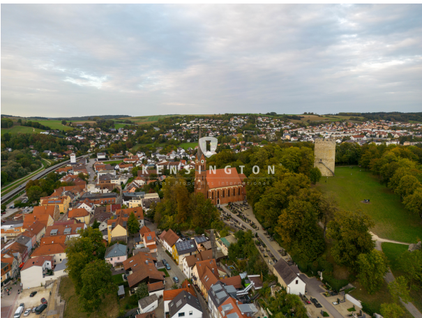
Willkommen in Ihrem neuen Zuhause