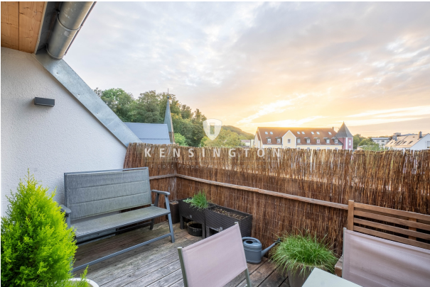
Atemberaubender Blick über den Ort!