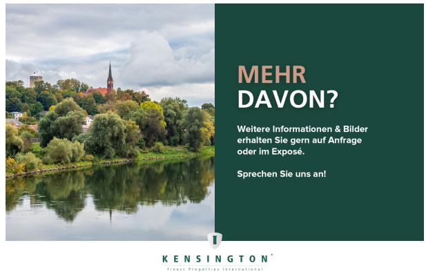
Sie möchten mehr davon?