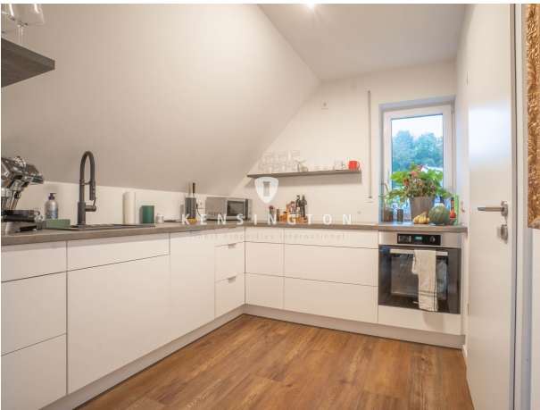
Und einzigartiger Schreiner-Einbauküche!