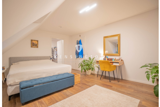
Ihr neuer, ruhiger Schlafbereich