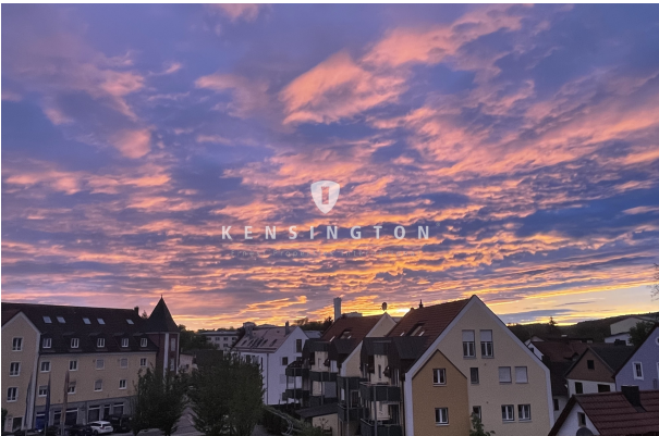
Die schönsten Sonnenuntergänge gibt es hier!