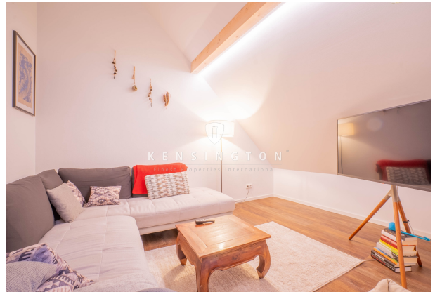
Kuschelige TV-Lounge für Ihre Filmabende