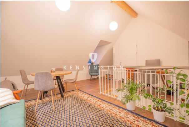
Galerie-Bereich, perfekt umgesetzt!