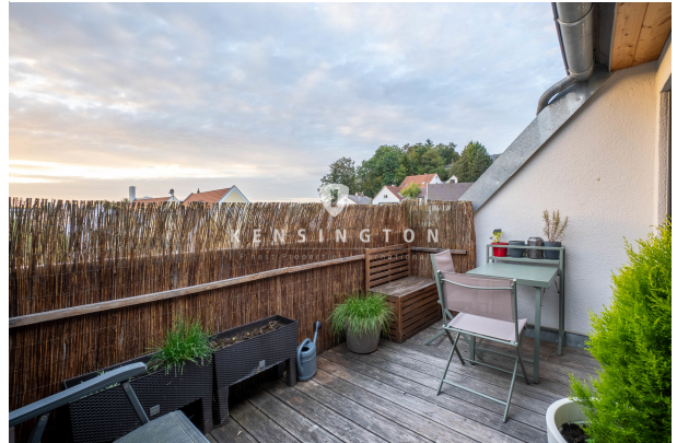
Auf Ihrem eigenen Süd-West-Balkon!