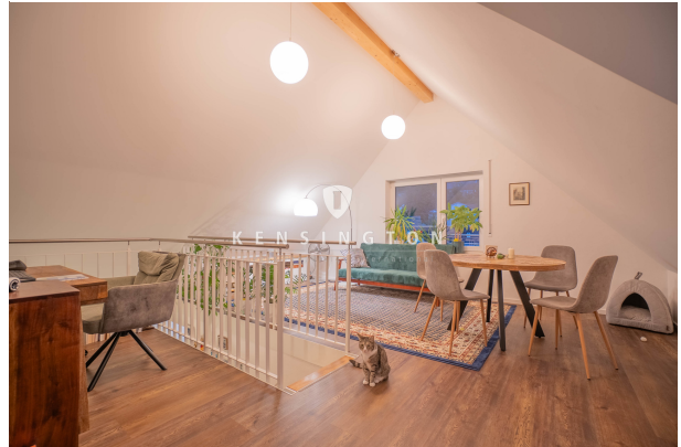
Vielfältige Wohnmöglichkeiten! (Ohne Katze ;))