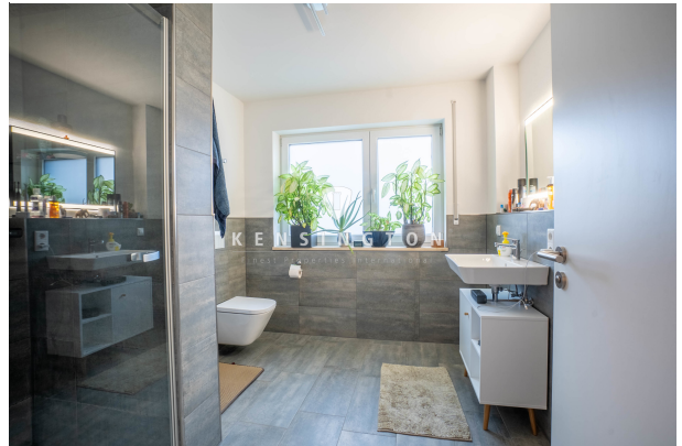
Elegant & zeitlos, mit bodentiefer Dusche!