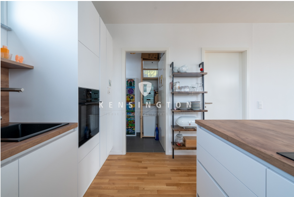
Detailfoto aus der Küche!