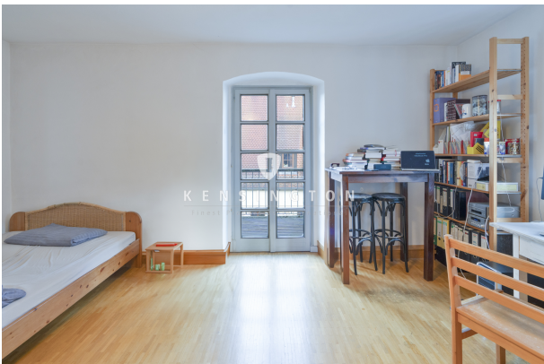
Ihr neuer Schlafbereich (Einrichtungsbsp.)!