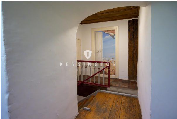
Direkt an der wunderbaren Donau!