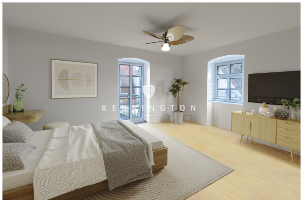
Mit Zugang zum Balkon!