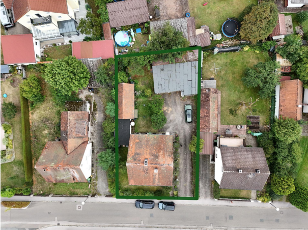
Nachbarschaft aus Alt-/Neubau!