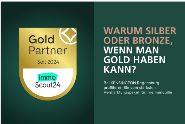
Gold Partner - ImmoScout24