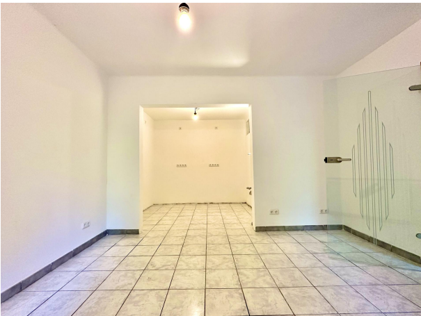
Zimmer Hauptwohnung zum Garten