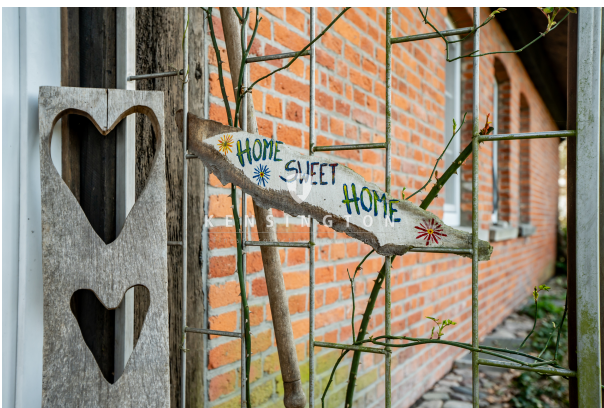
Home Sweet Home