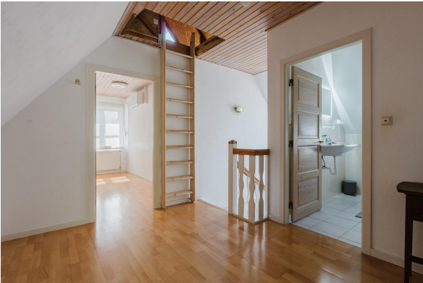
Großer Flur im DG