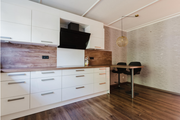
Einbauküche mit Essecke