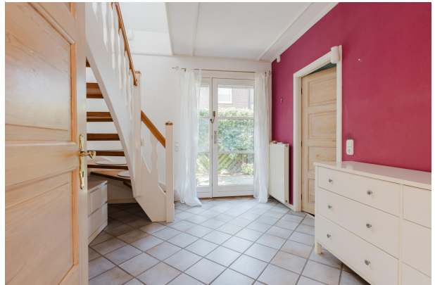
Eingangsbereich mit Zugang zum Badezimmer