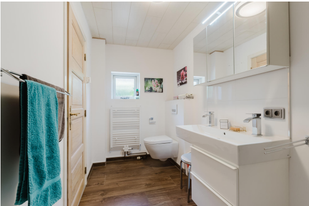
Badezimmer im EG