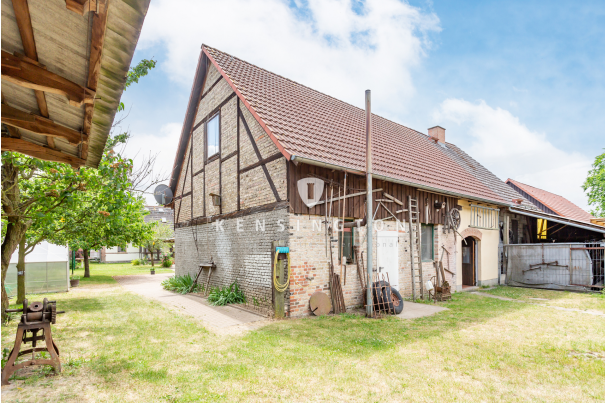
Nebenglass von hinten