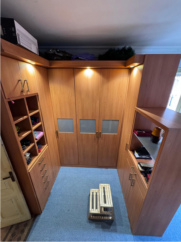
WhatsApp Image 2024-09-25 at 14.46.07