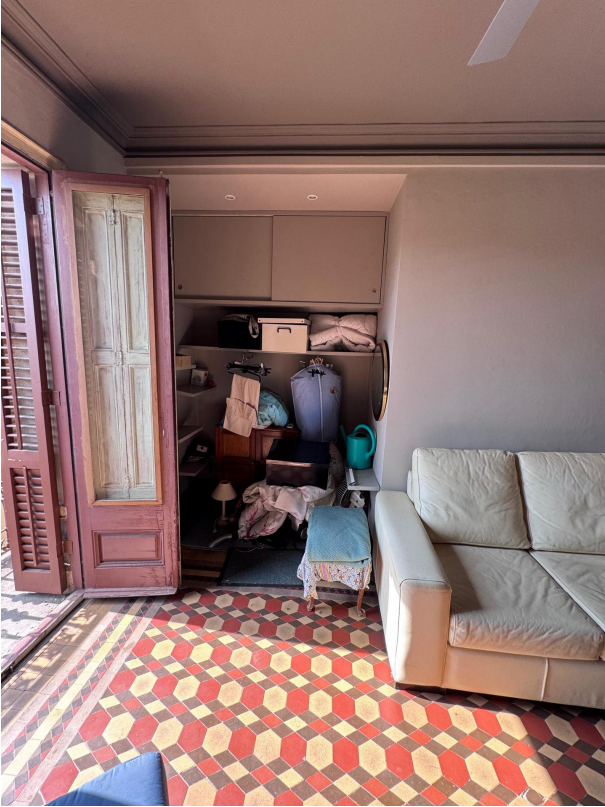
WhatsApp Image 2024-09-25 at 14.46.00 (1)