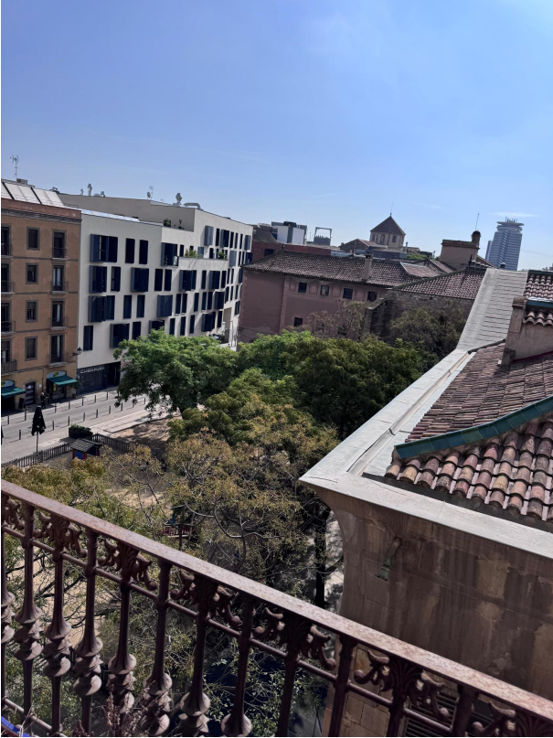
WhatsApp Image 2024-09-25 at 14.46.14