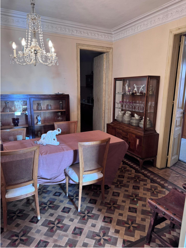
WhatsApp Image 2024-09-25 at 14.46.12 (1)