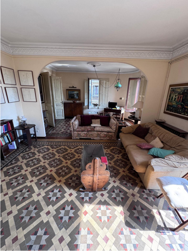
WhatsApp Image 2024-09-25 at 14.46.03 (1)