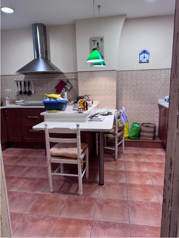
WhatsApp Image 2024-09-25 at 14.46.08 (1)