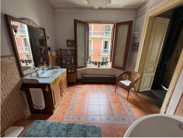
WhatsApp Image 2024-09-25 at 14.46.05 (2)