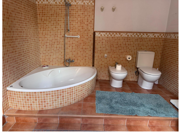
WhatsApp Image 2024-09-25 at 14.46.05