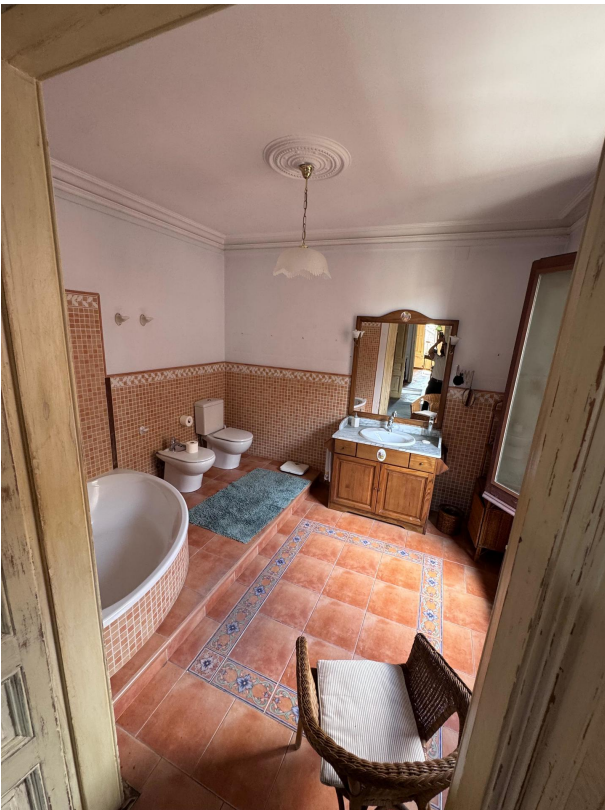
WhatsApp Image 2024-09-25 at 14.46.06 (1)