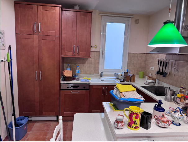
WhatsApp Image 2024-09-25 at 14.46.09 (1)