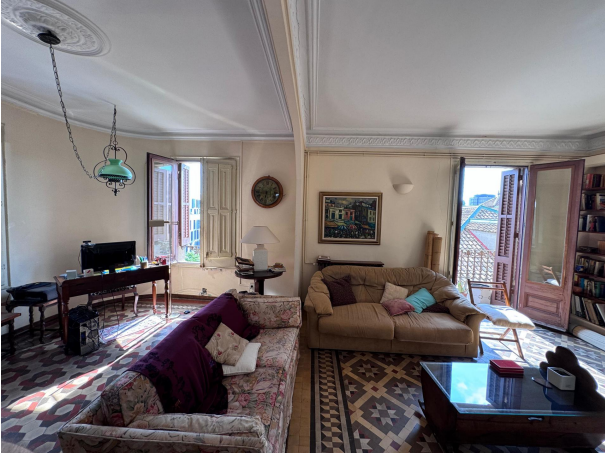
WhatsApp Image 2024-09-25 at 14.46.01