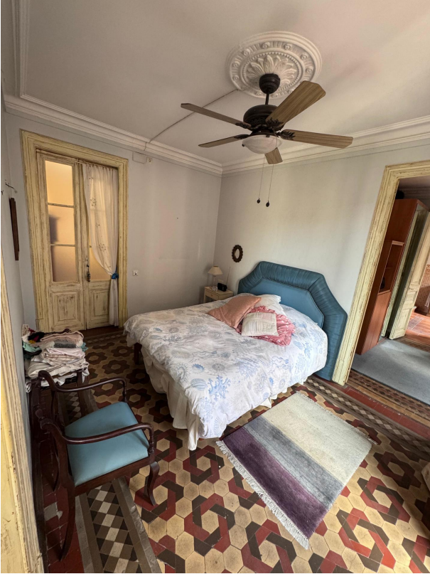
WhatsApp Image 2024-09-25 at 14.46.04 (1)