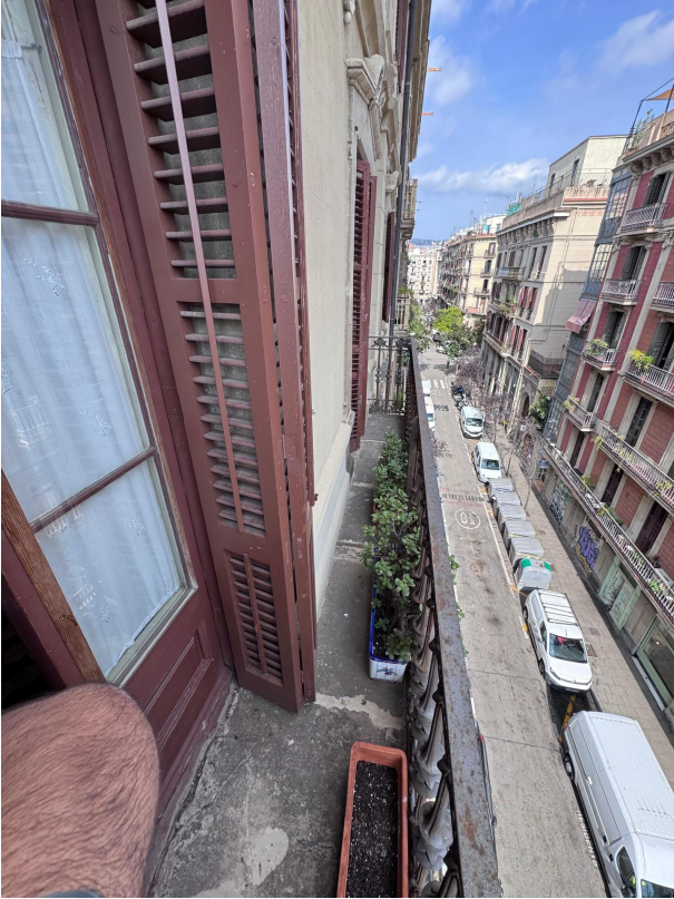
WhatsApp Image 2024-09-25 at 14.45.59