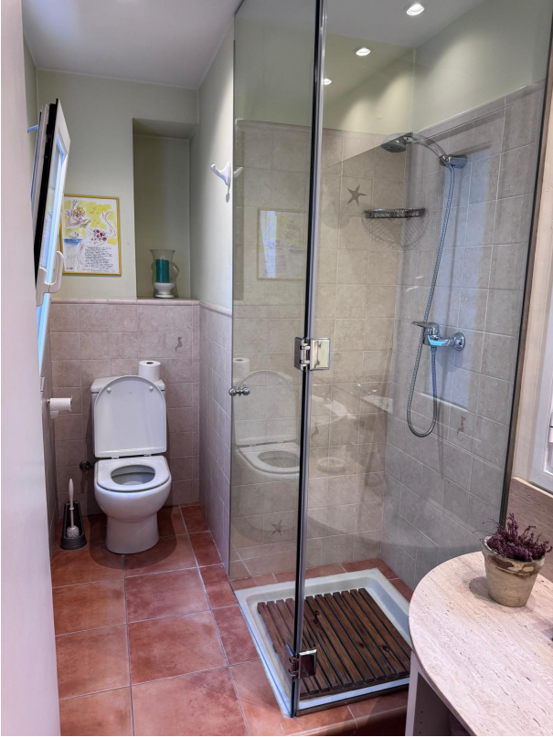
WhatsApp Image 2024-09-25 at 14.46.10