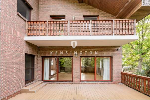
Terrasse in den Garten