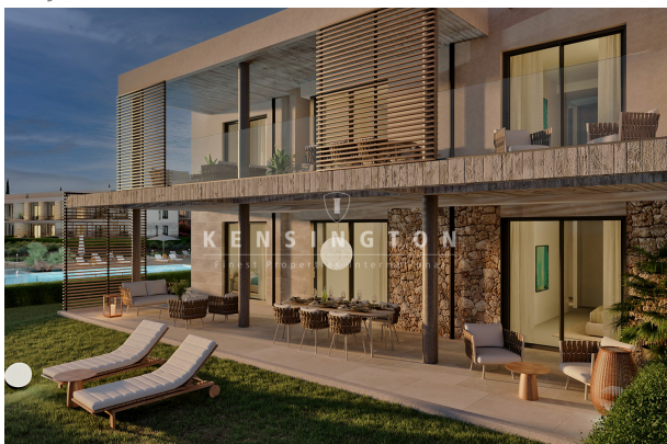
Porch (ground floor)