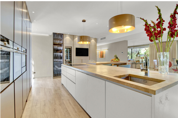
Cocina amplia y con estilo