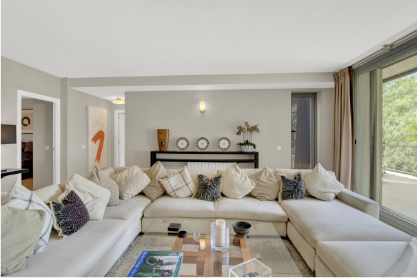
Bonita sala de estar con mucho espacio