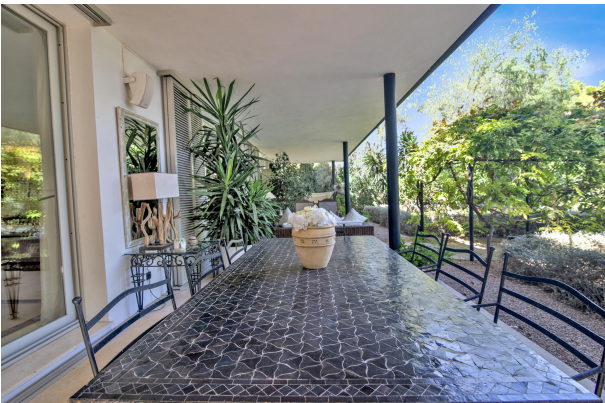
Villa con gran zona exterior