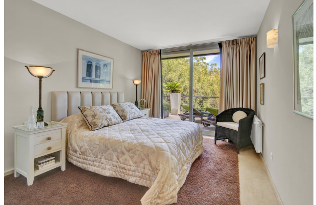
Bonito y amplio dormitorio