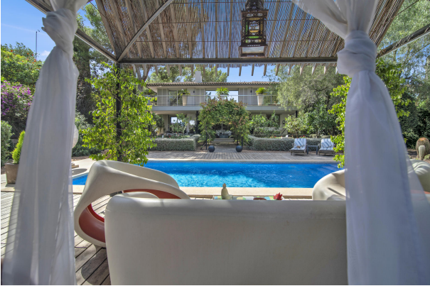
Villa moderna con bonita zona exterior