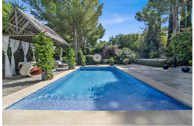
Villa con hermosa piscina Moderno