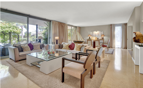
Luminoso salón Villa Sol de Mallorca de Mallorca