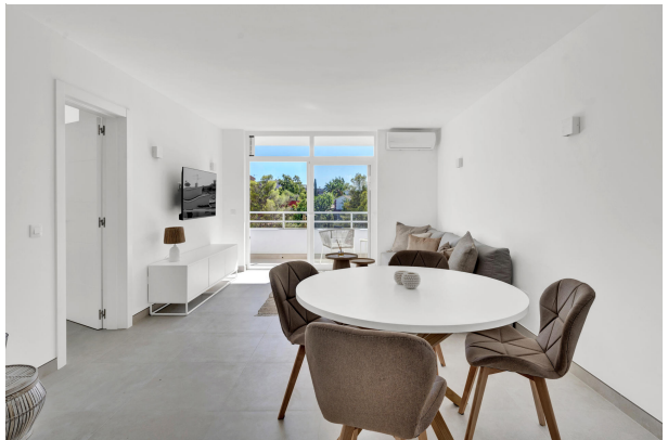
Hermosa y luminosa entrada