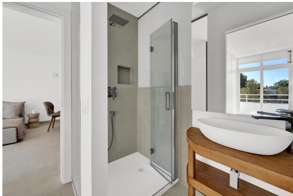
Baño luminoso y abierto