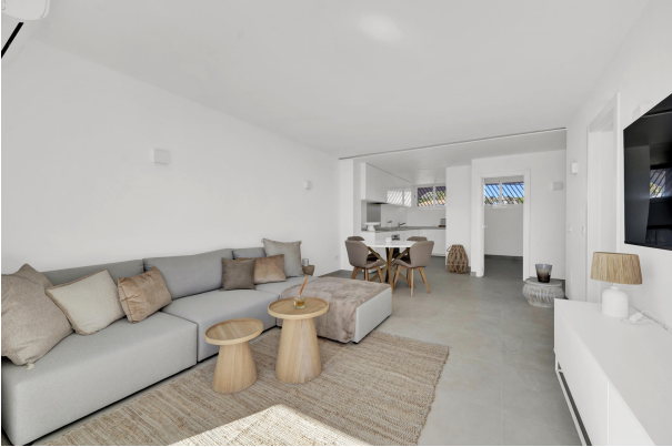
Excelente apartamento renovado