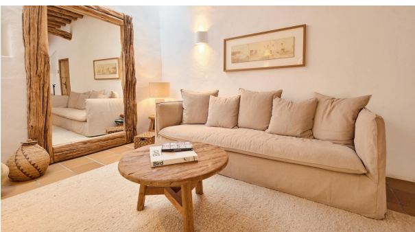
KPI1310 - Villa en venta - Villa zu verkaufen - Villa for sale - Villa te koop - www.kensington-ibiza.com - Noelle Politiek