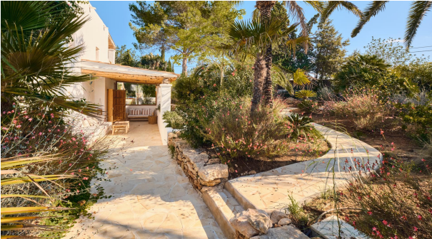
2KPI1310 - Villa en venta - Villa zu verkaufen - Villa for sale - Villa te koop - www.kensington-ibiza.com - Noelle Politiek