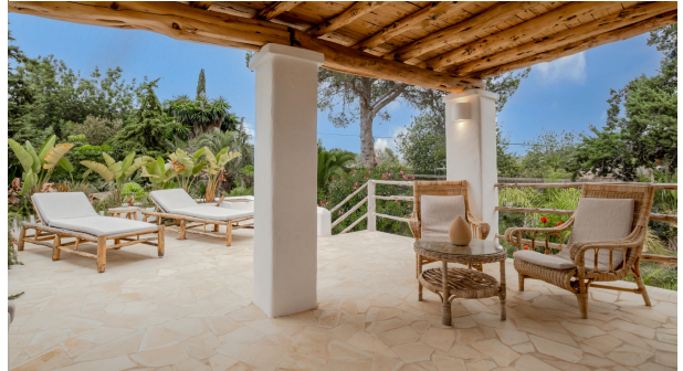
KPI1310 - Villa en venta - Villa zu verkaufen - Villa for sale - Villa te koop - www.kensington-ibiza.com - Noelle Politiek