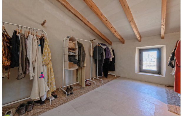
Bedroom 2 (1st floor)