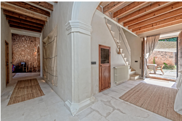
Bedroom 4 (ground floor)