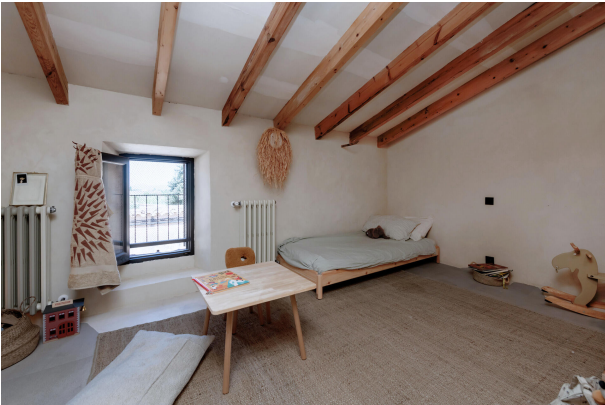
Bedroom 3 (1st floor)