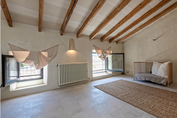
TV room (1st floor)