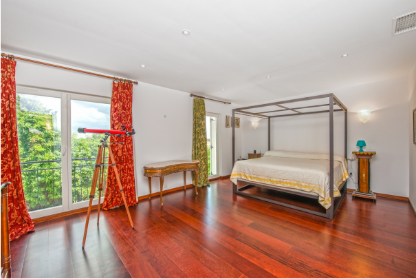
Dormitorio de hermoso chalet en venta en Magaluf