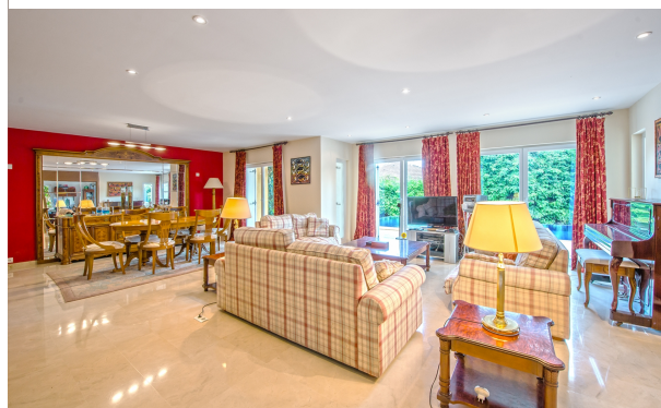
Amplio salón / comedor de hermoso chalet en Magaluf Mallorca