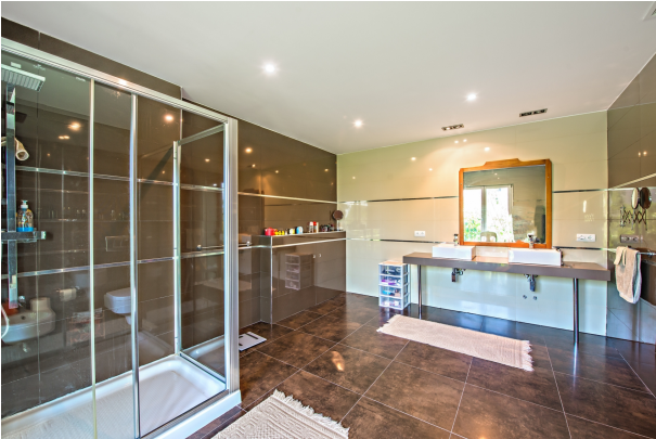
Lujoso baño de chalet en venta en Magaluf