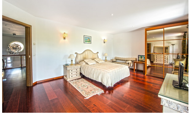
Acogedor y lujoso dormitorio chalet en venta en Magaluf