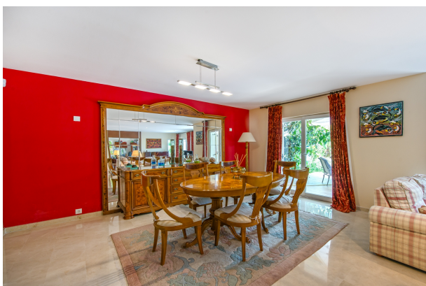
Comedor en moderno chalet en venta en Mallorca