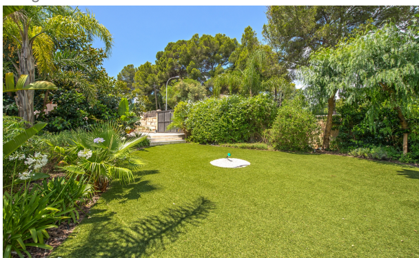
Grande y bien cuidado jardín chalet en venta en Magaluf Mallorca