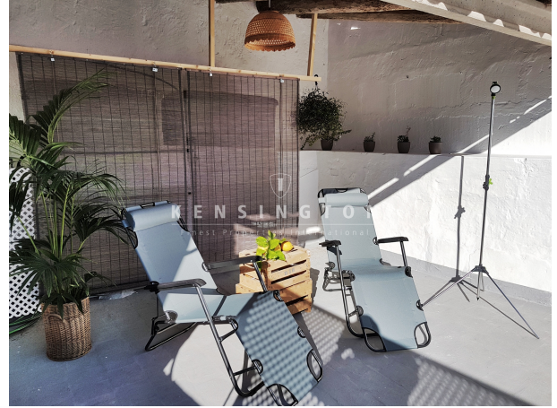
Casa de pueblo en Porreres corredor