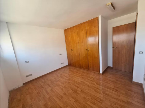
Captura de pantalla 2024-08-29 140238