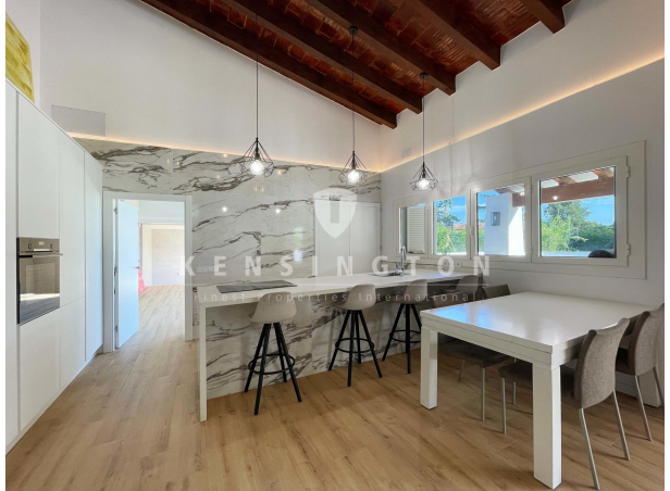
Cocina - Casa invitados