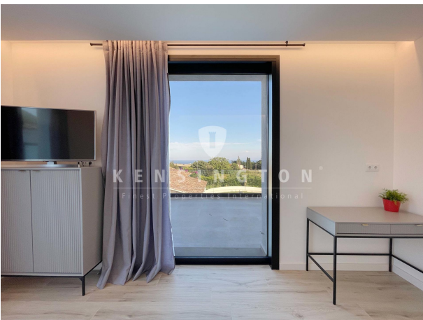
Suite 2 - 1ª planta