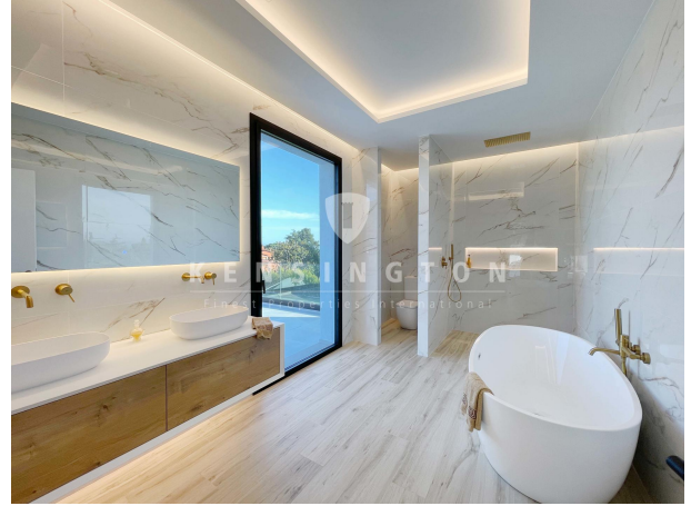
Suite 3 - 1ª planta