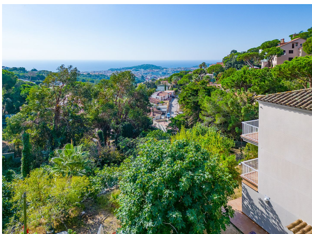
WhatsApp Image 2025-02-21 at 17.58.19 (4)