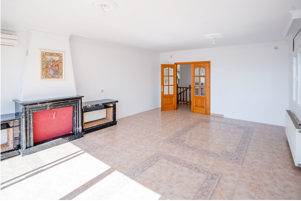
WhatsApp Image 2025-02-21 at 17.58.18 (3)