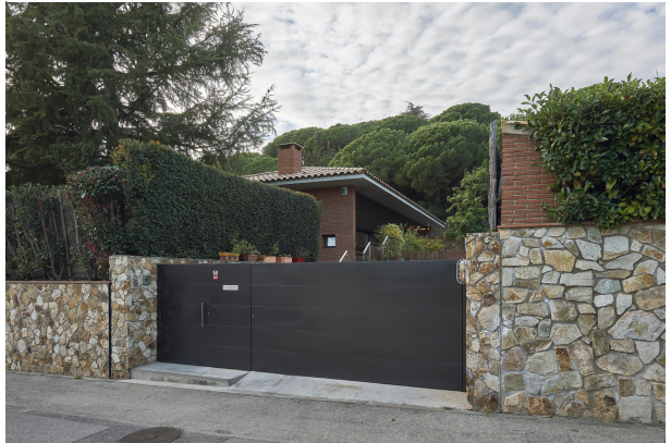
191202-Vivenda HIGH 061