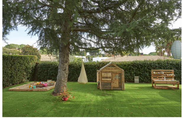
191202-Vivenda HIGH 009