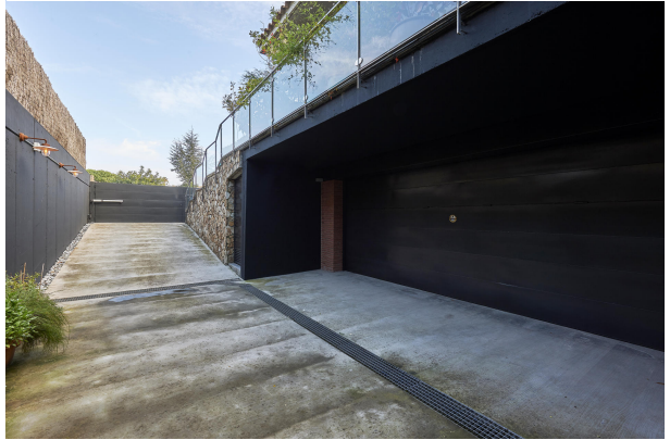
191202-Vivenda HIGH 057