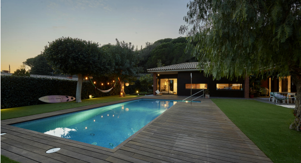
191202-Vivenda HIGH 067