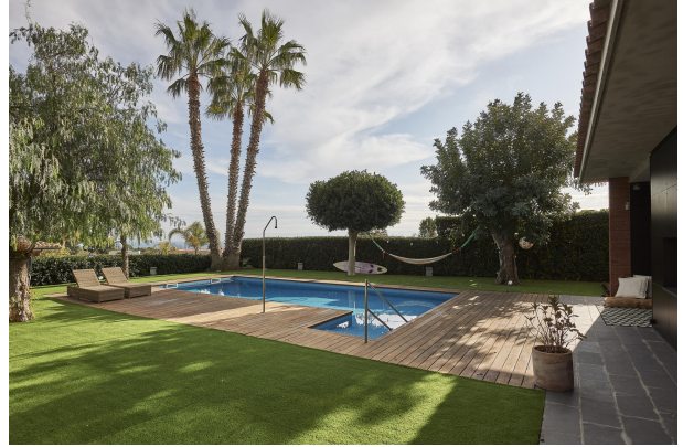
191202-Vivenda HIGH 025