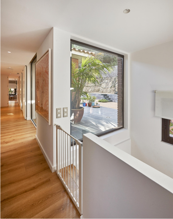
191202-Vivenda HIGH 038