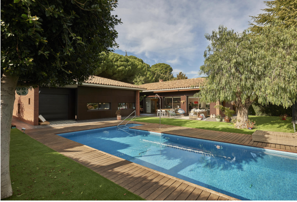
191202-Vivenda HIGH 028