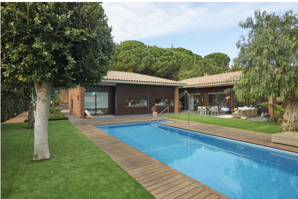
191202-Vivenda HIGH 004