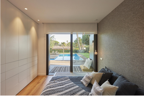
191202-Vivenda HIGH 050