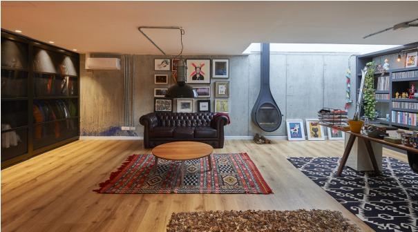
191202-Vivenda HIGH 012