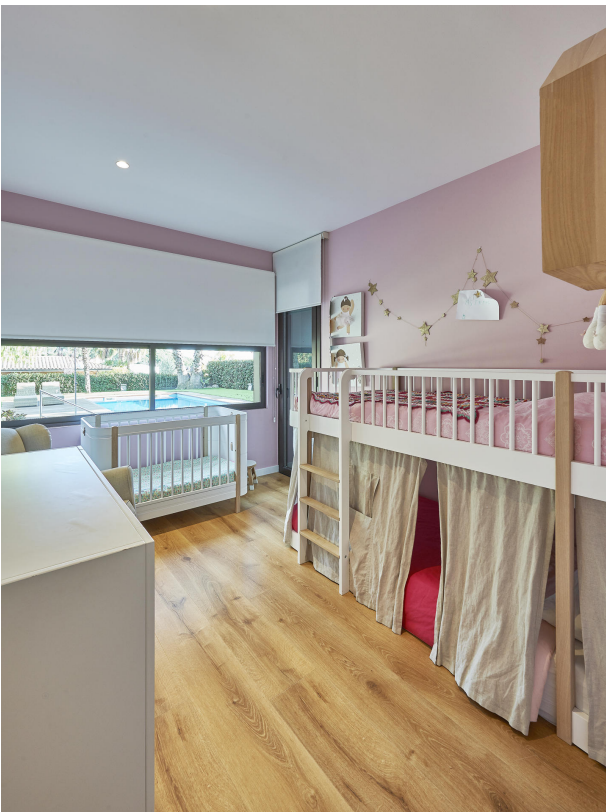
191202-Vivenda HIGH 048