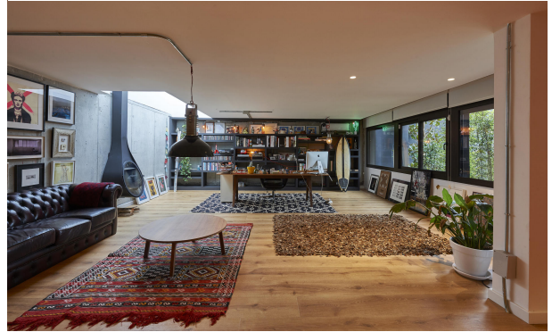
191202-Vivenda HIGH 011