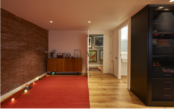
191202-Vivenda HIGH 016