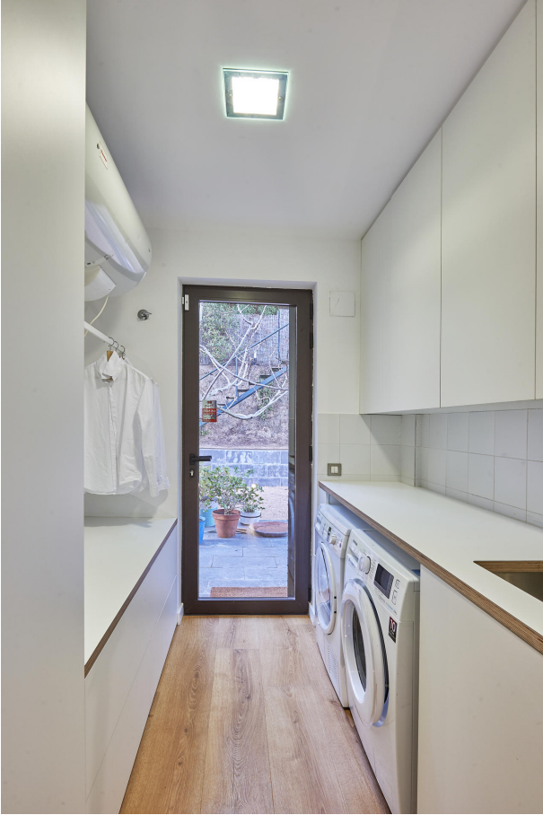
191202-Vivenda HIGH 054