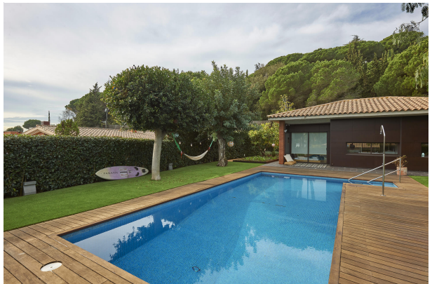
191202-Vivenda HIGH 005