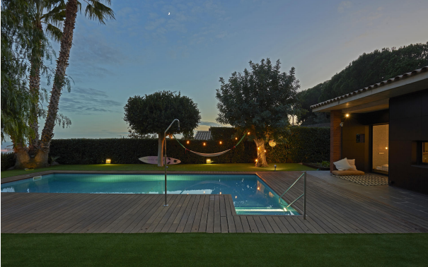
191202-Vivenda HIGH 070