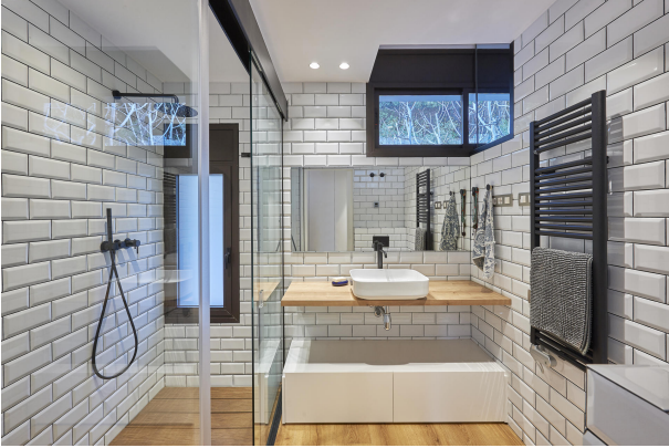
191202-Vivenda HIGH 052