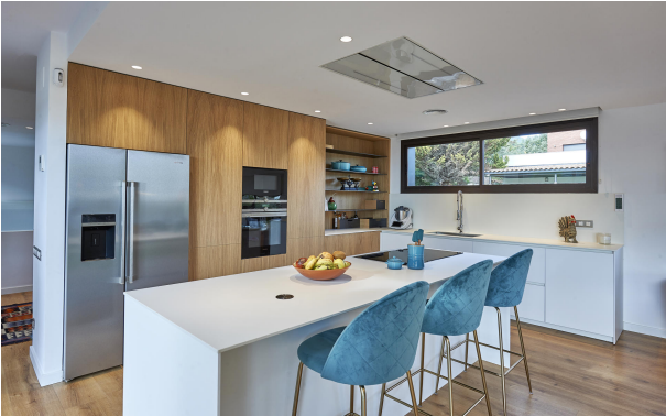
191202-Vivenda HIGH 022