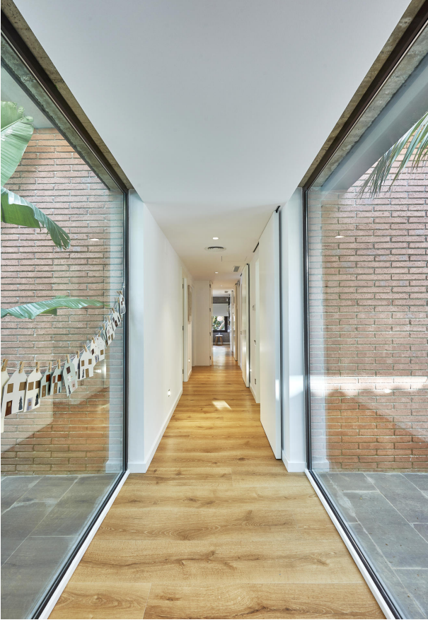
191202-Vivenda HIGH 036