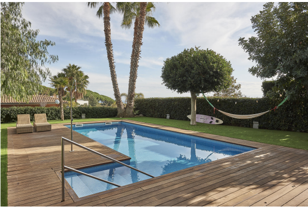
191202-Vivenda HIGH 030