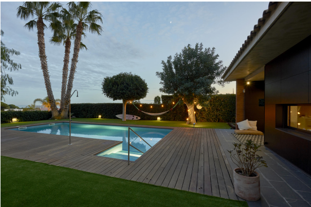
191202-Vivenda HIGH 069