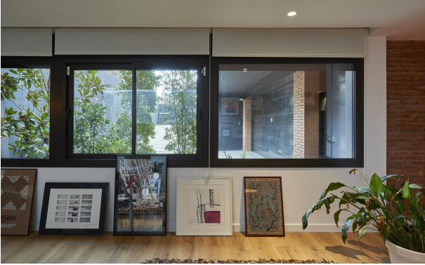
191202-Vivenda HIGH 014