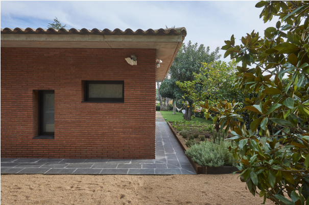
191202-Vivenda HIGH 010