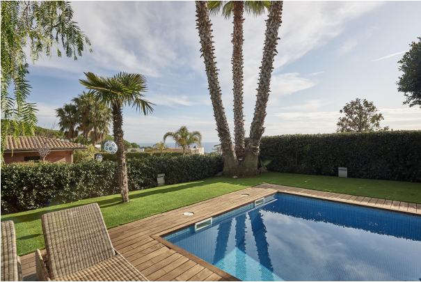
191202-Vivenda HIGH 026