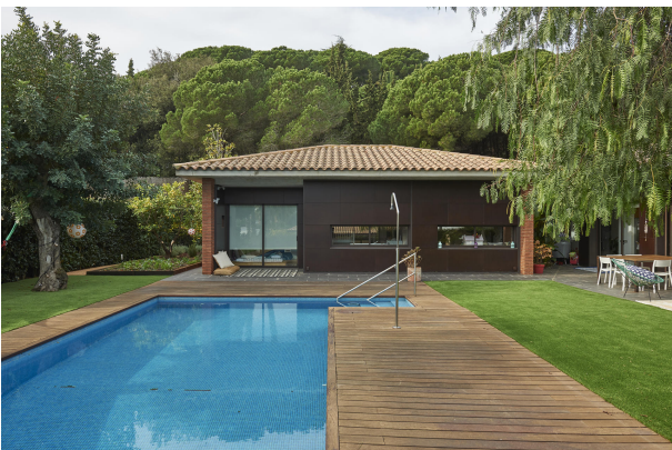
191202-Vivenda HIGH 006