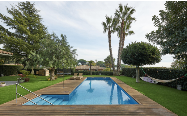
191202-Vivenda HIGH 002