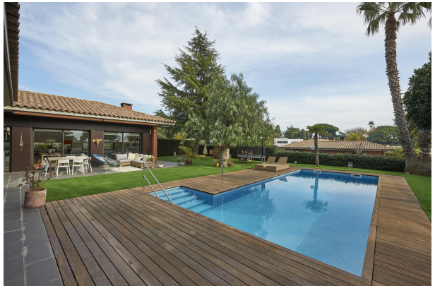
191202-Vivenda HIGH 003