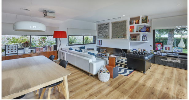
191202-Vivenda HIGH 019