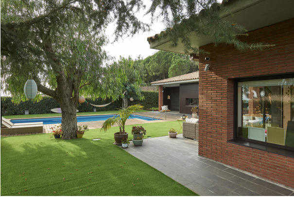
191202-Vivenda HIGH 008