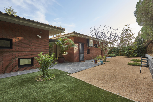
191202-Vivenda HIGH 044