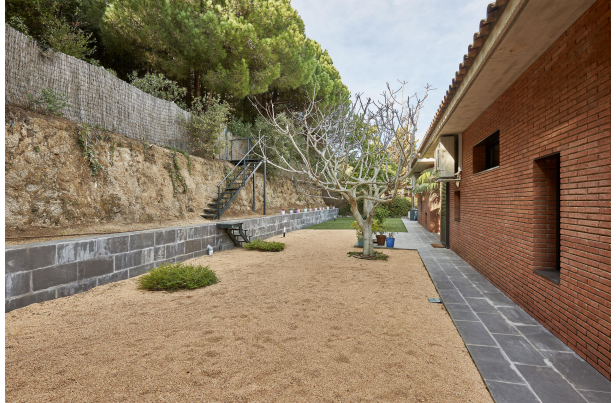
191202-Vivenda HIGH 041