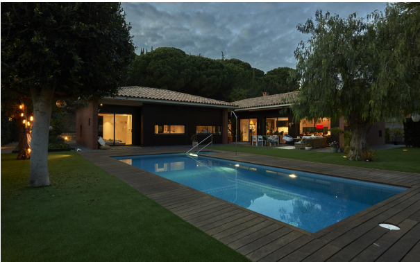
191202-Vivenda HIGH 065