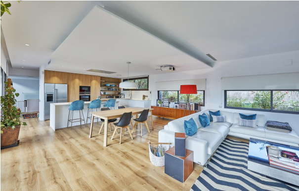
191202-Vivenda HIGH 020