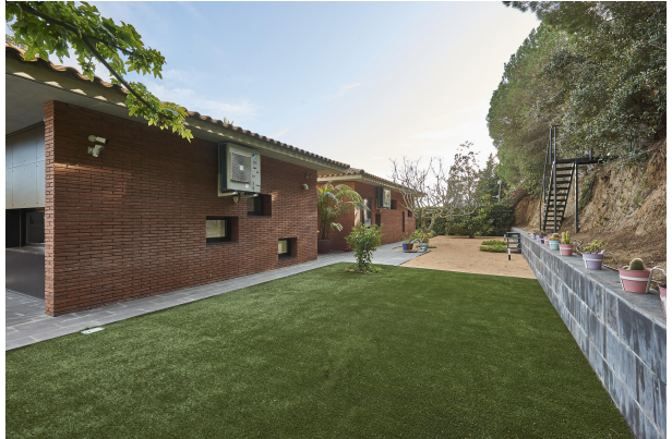
191202-Vivenda HIGH 043