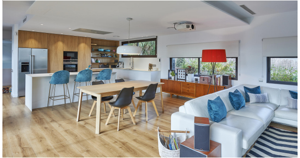
191202-Vivenda HIGH 021