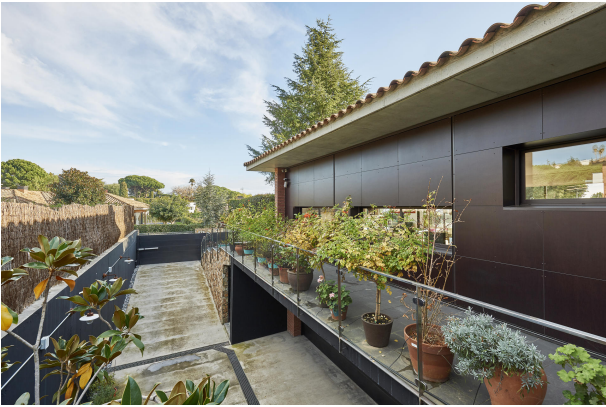
191202-Vivenda HIGH 046