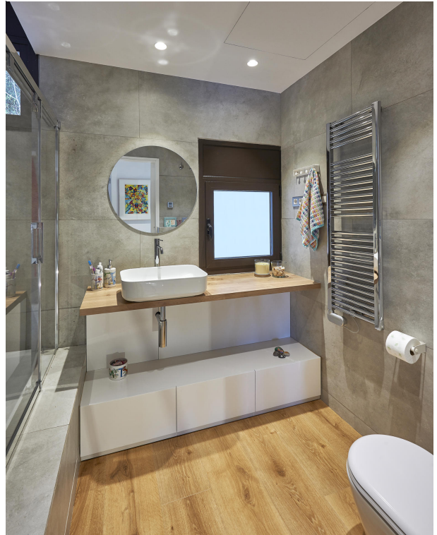
191202-Vivenda HIGH 047