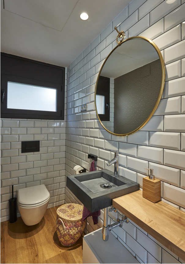
191202-Vivenda HIGH 032