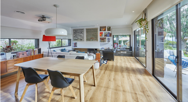
191202-Vivenda HIGH 018