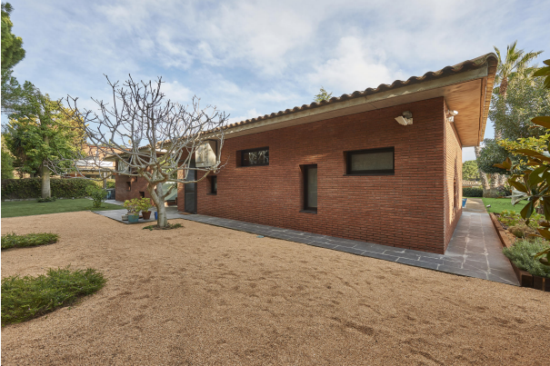
191202-Vivenda HIGH 040