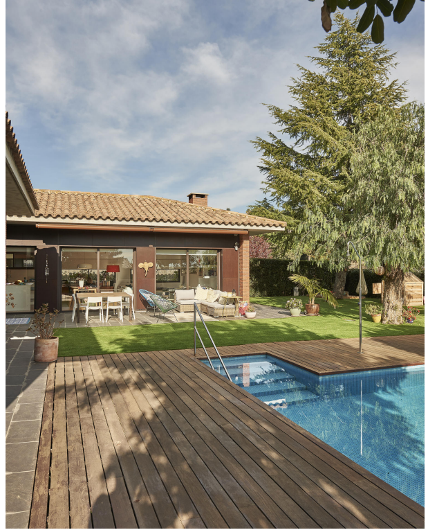
191202-Vivenda HIGH 029