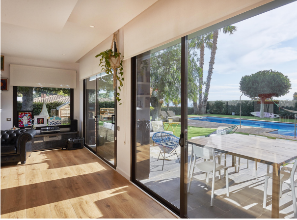
191202-Vivenda HIGH 024