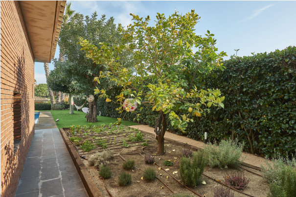
191202-Vivenda HIGH 042