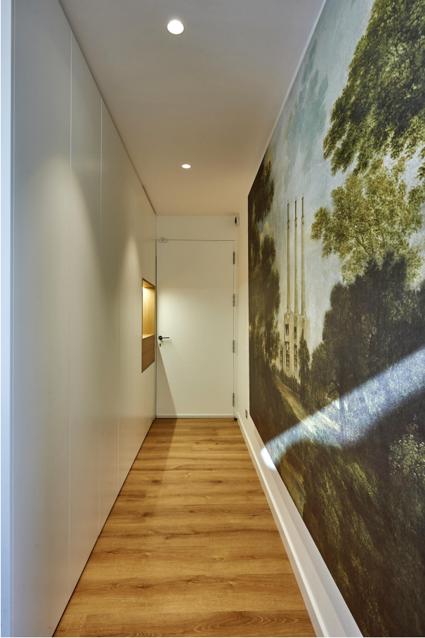
191202-Vivenda HIGH 034