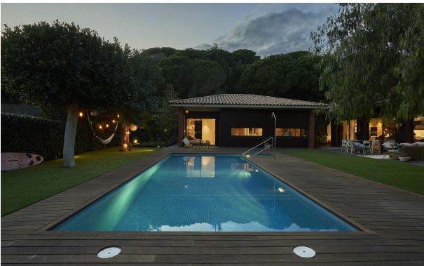
191202-Vivenda HIGH 066