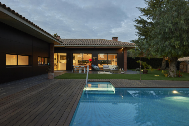
191202-Vivenda HIGH 068