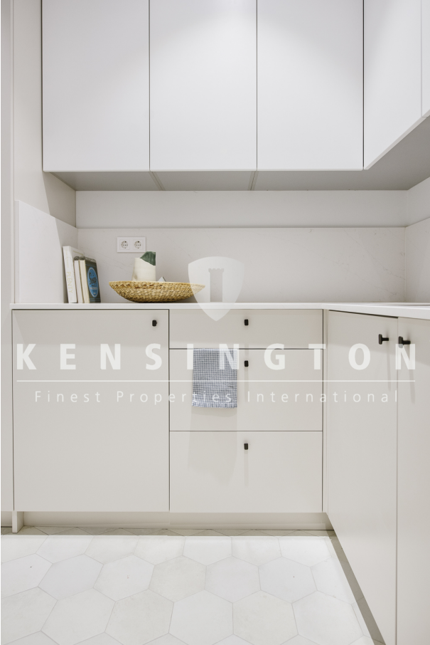
14 Cocina 3