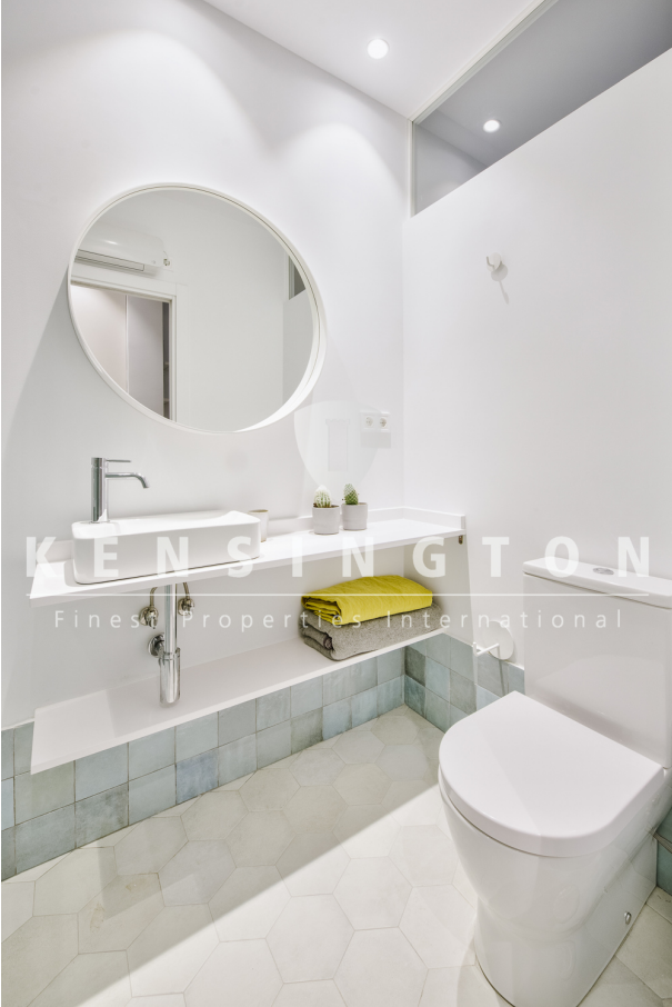
17 Baño 2