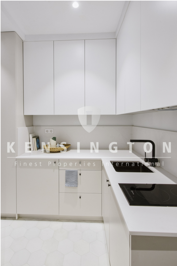
12 Cocina 1