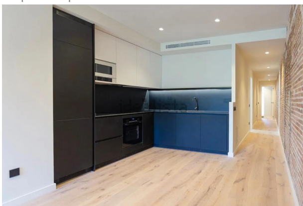
Captura de pantalla 2024-08-09 130255