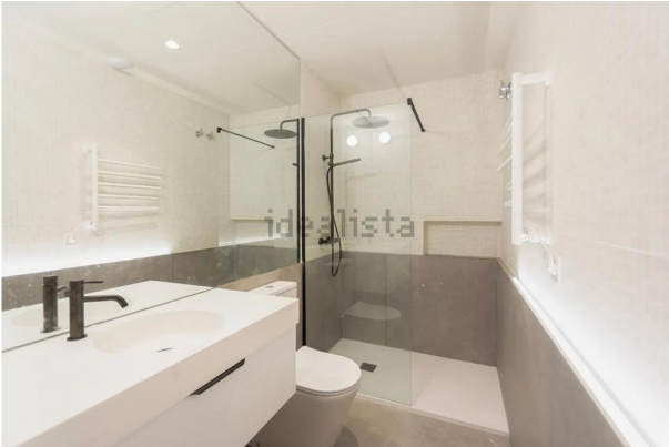
Captura de pantalla 2024-08-09 130135