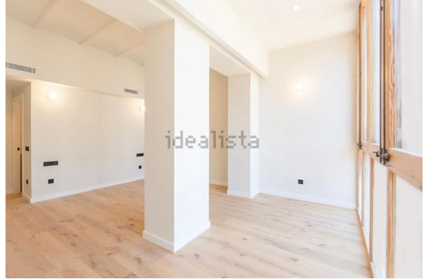
Captura de pantalla 2024-08-09 130113