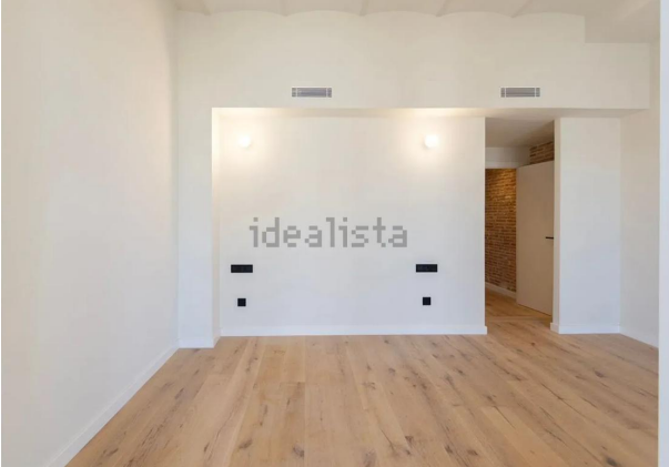
Captura de pantalla 2024-08-09 130729