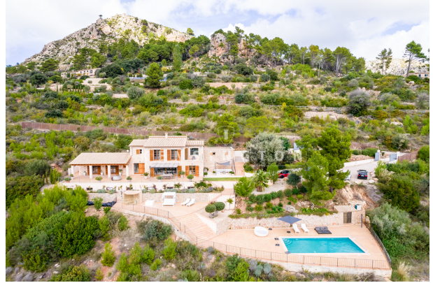
Finca en Andratx vistas al las montañas