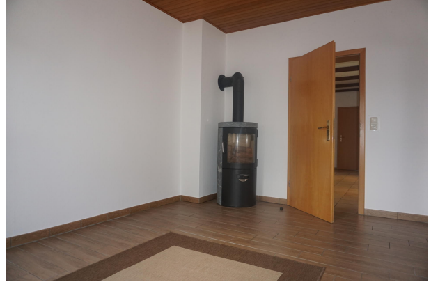
Wohnbereich mit Kaminofen im Erdgeschoss