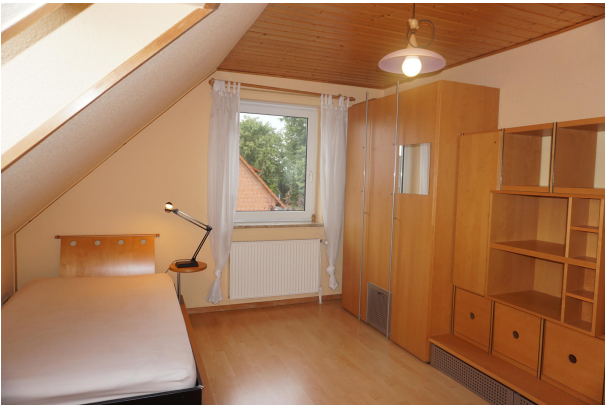
Schlafzimmer I im Dachgeschoss