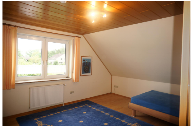
Schlafzimmer II im Dachgeschoss