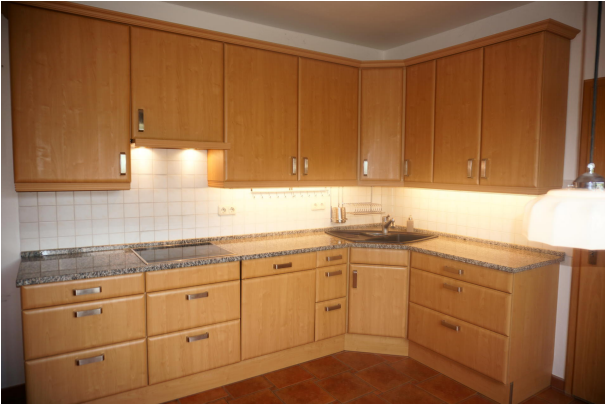
Küche im Erdgeschoss