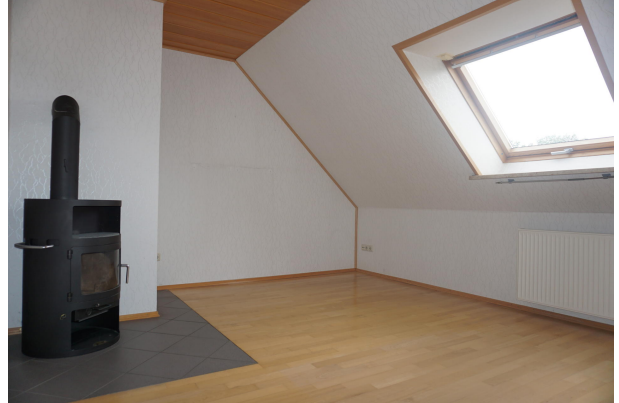
Wohnbereich mit Kaminofen im Dachgeschoss