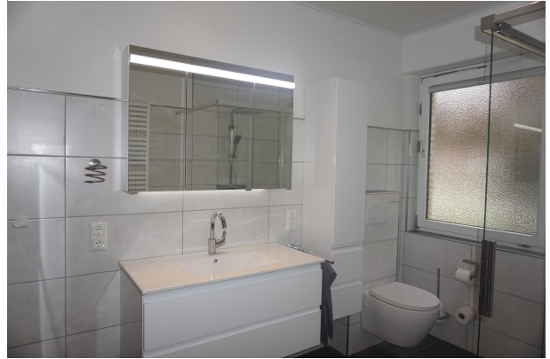
Bad im Erdgeschoss