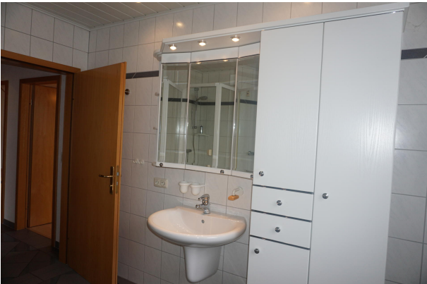
Duschbad im Dachgeschoss