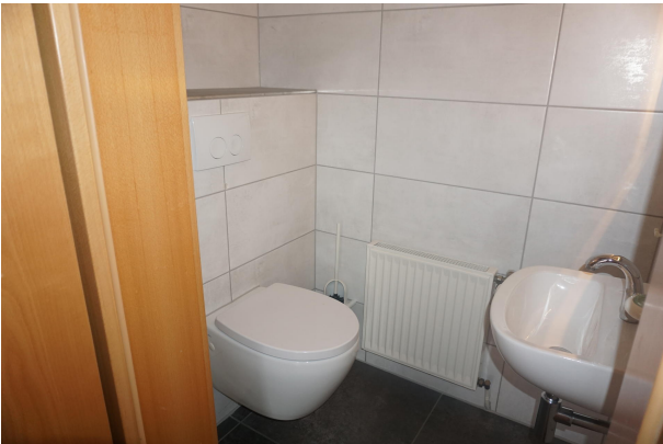
Gäste WC im Erdgeschoss