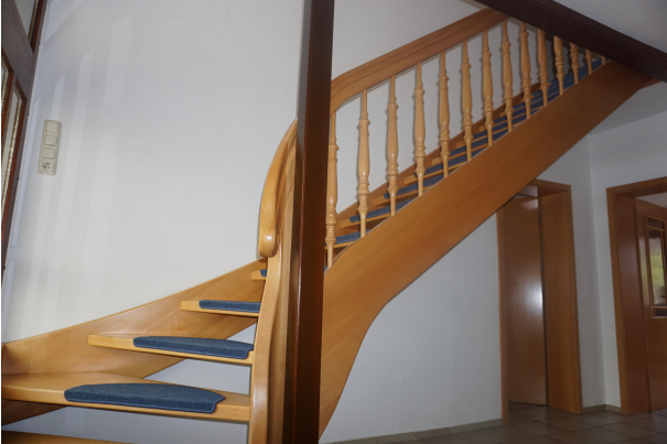
Treppe zum Dachgeschoss