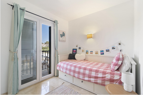
7. Dormitorio 2