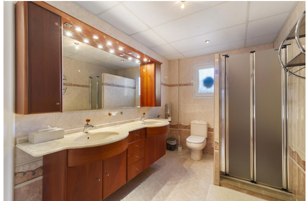
6. Baño principal