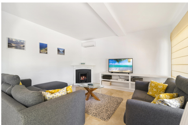
3. Sala de estar