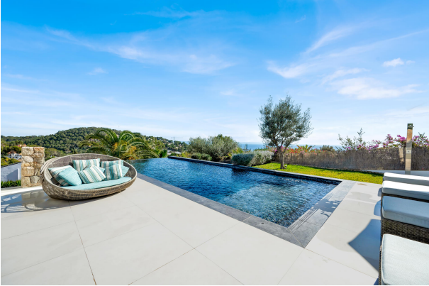
Panoramic sea view