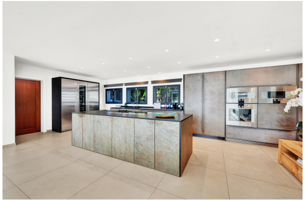
Villa for sale in Costa den Blanes