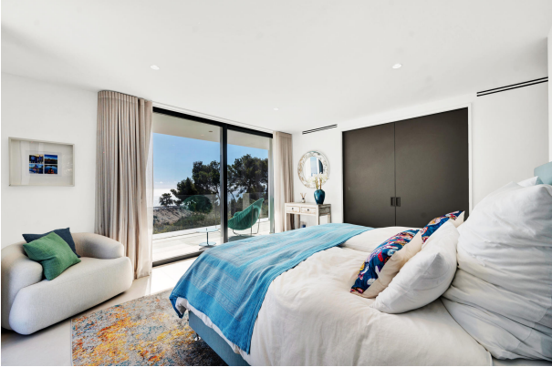
Master bedroom with sea views