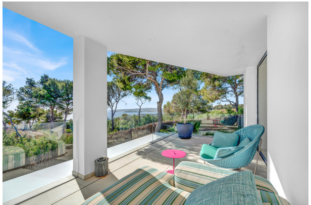
Terrace with sea views