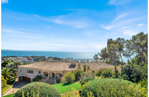
Stunning sea view terrace