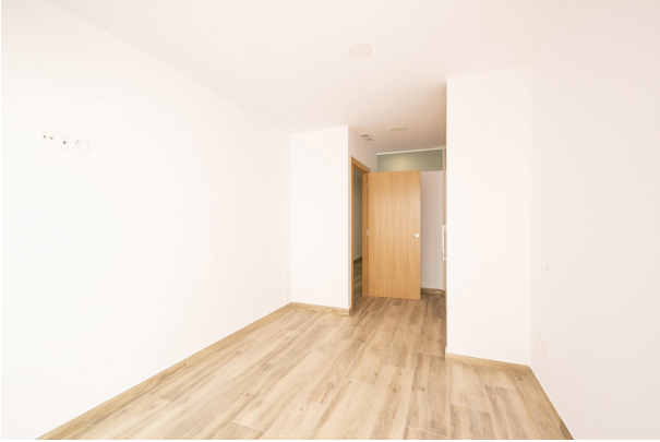
_MR_1152 copia 2