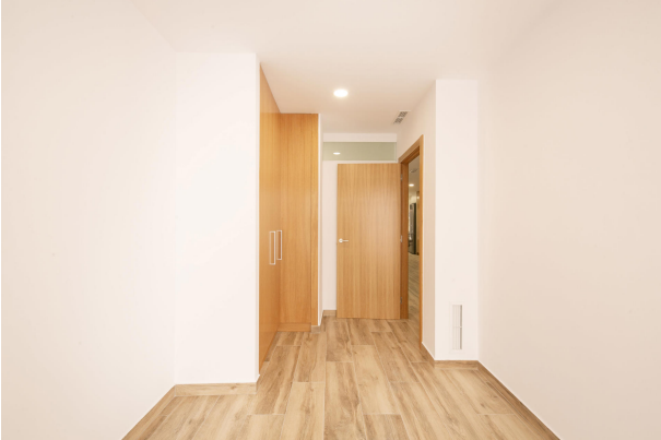
_MR_1140 copia 2