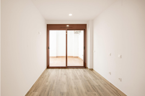
_MR_1137 copia 2