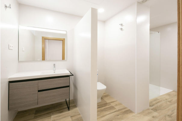
_MR_1132 copia 2