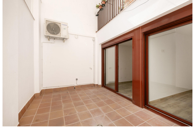
_MR_1145 copia 2