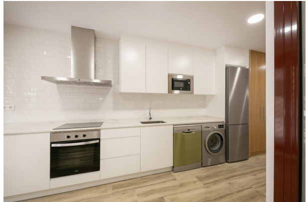
_MR_1116 copia 2