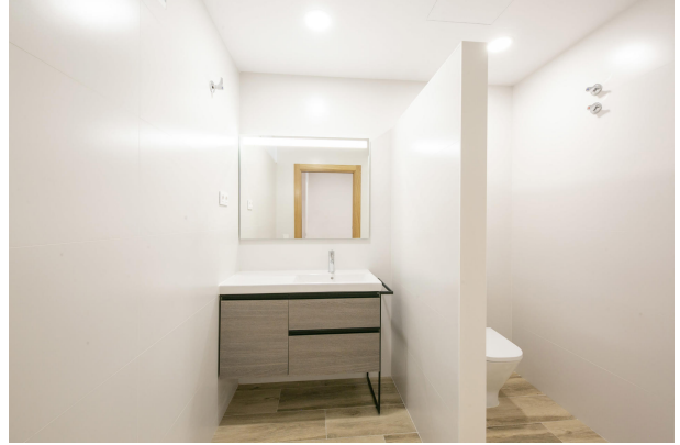
_MR_1131 copia 2