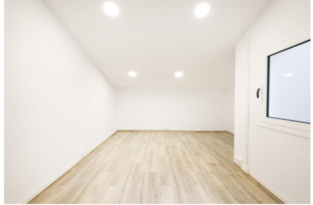
_MR_1153 copia 2