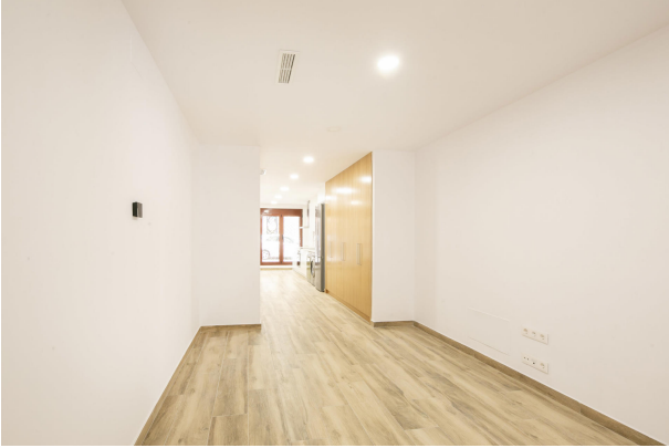
_MR_1130 copia 2