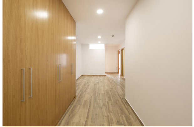
_MR_1118 copia 2