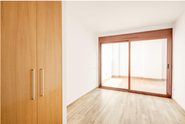
_MR_1146-HDR copia 2