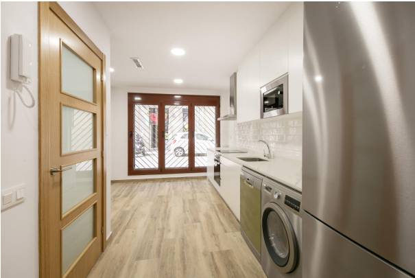
_MR_1125 copia 2