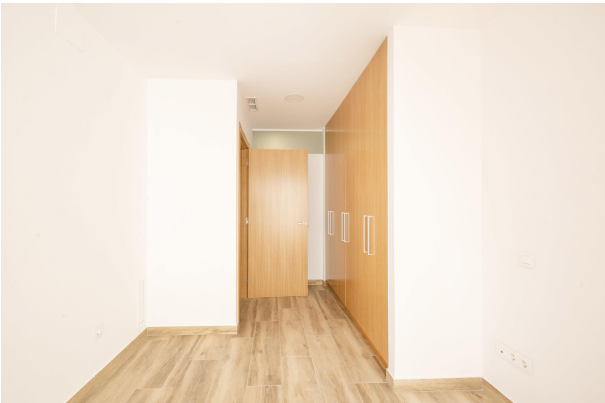
_MR_1150 copia 2