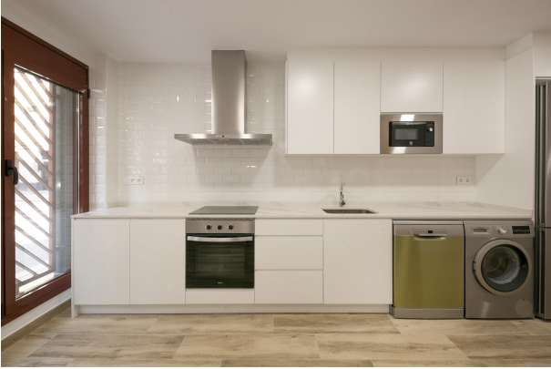
_MR_1117 copia 2