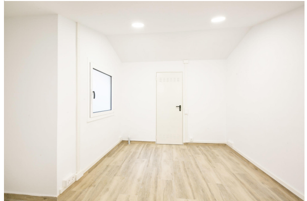
_MR_1155 copia 2