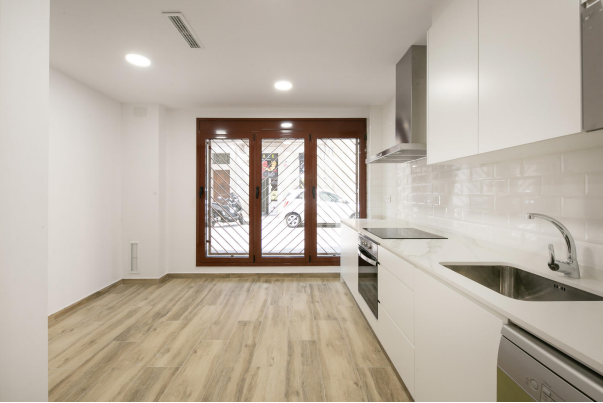
_MR_1108 copia 2