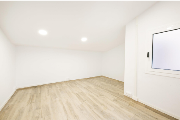
_MR_1154 copia 2