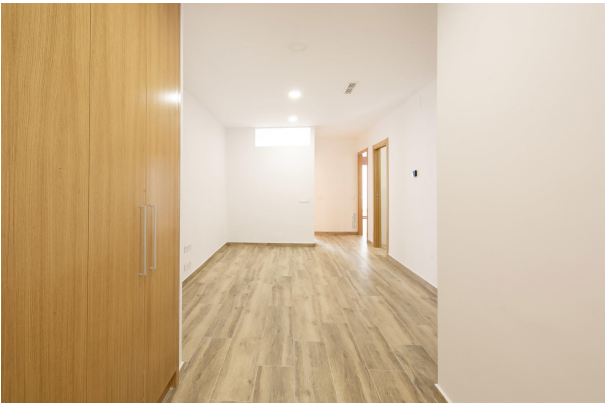
_MR_1121 copia 2