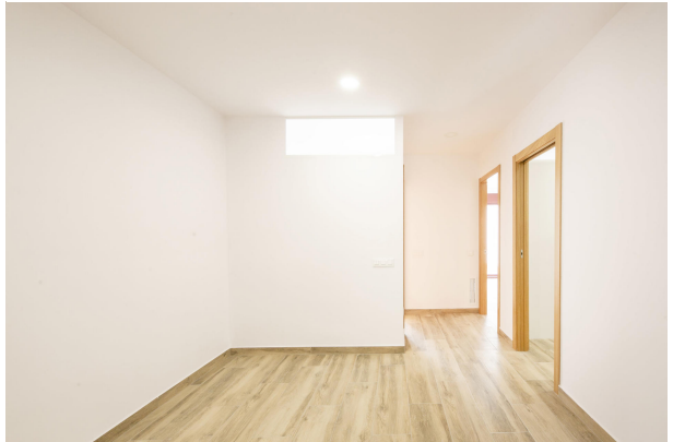
_MR_1126 copia 2