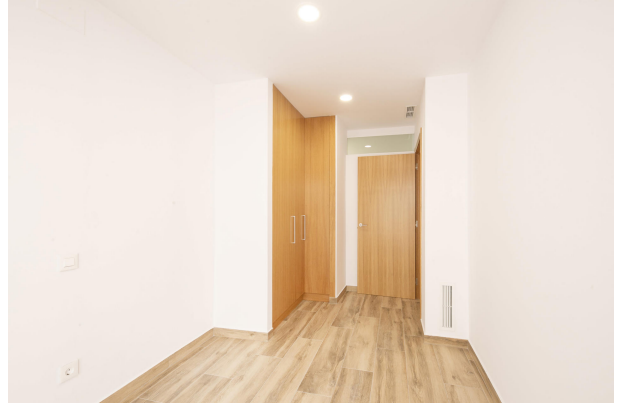
_MR_1141 copia 2