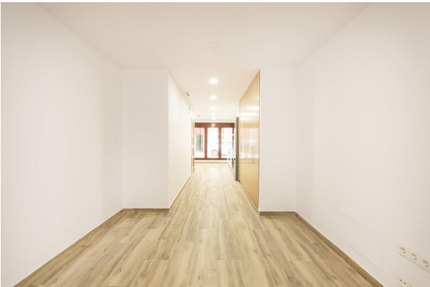
_MR_1128 copia 2