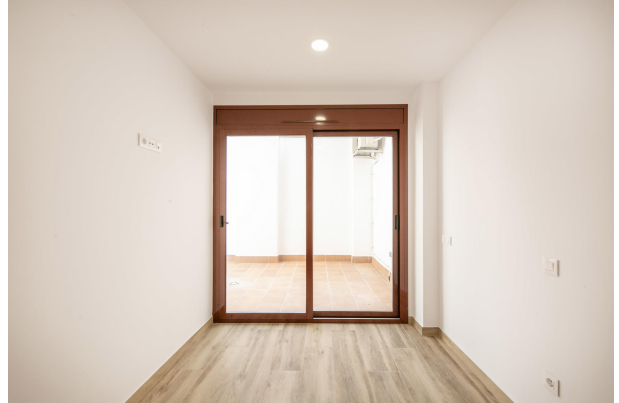
_MR_1139 copia 2