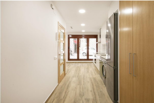
_MR_1123 copia 2