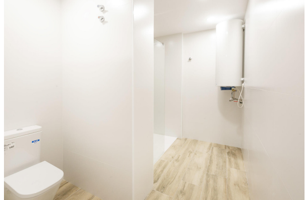
_MR_1133 copia 2