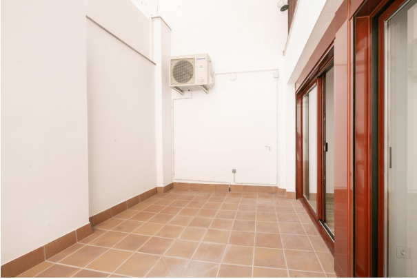
_MR_1144 copia 2