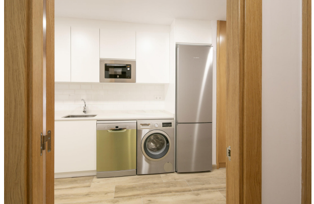
_MR_1120 copia 2