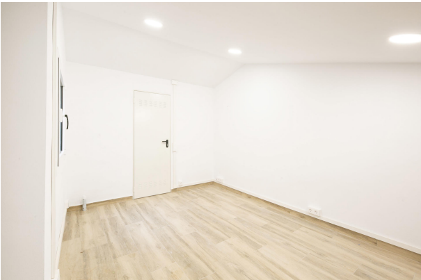
_MR_1156 copia 2