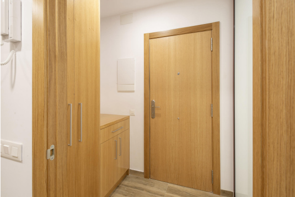
_MR_1119 copia 2