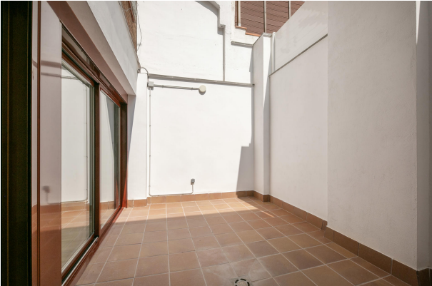
_MR_1142 copia 2