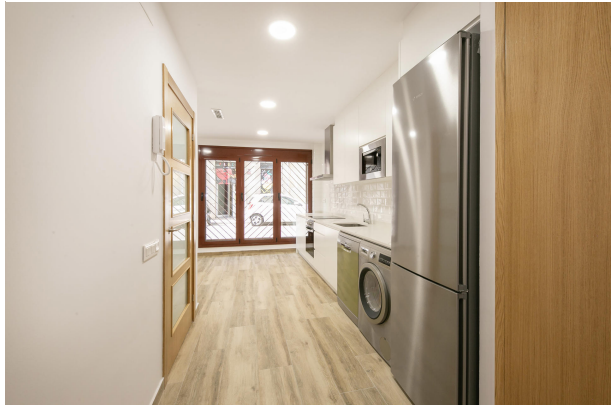
_MR_1124 copia 2