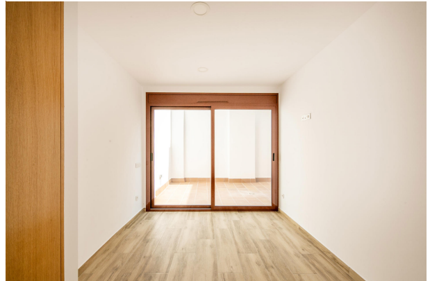
_MR_1148-HDR copia 2