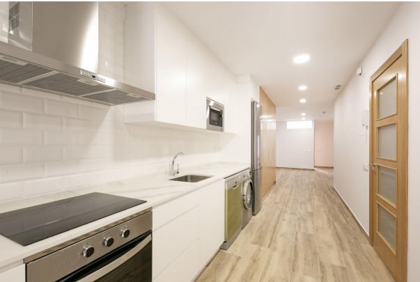
_MR_1112 copia 2