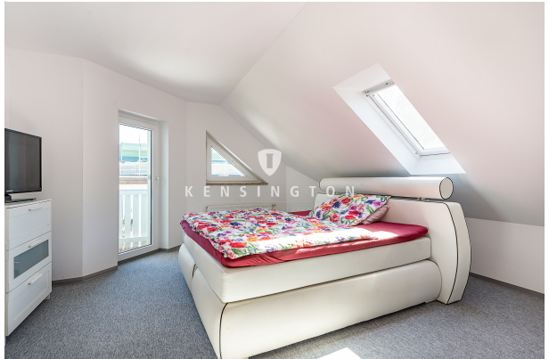
Schlafzimmer II WE1