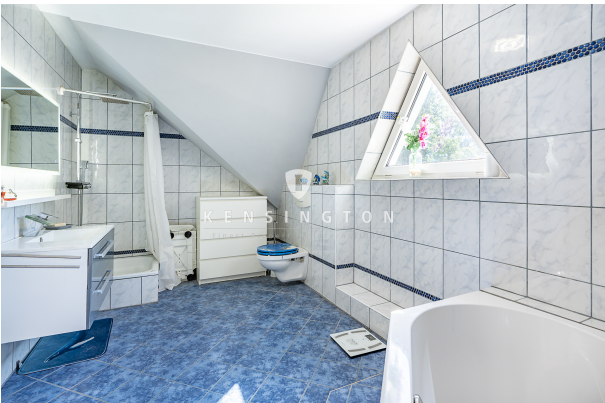
Badezimmer WE 2