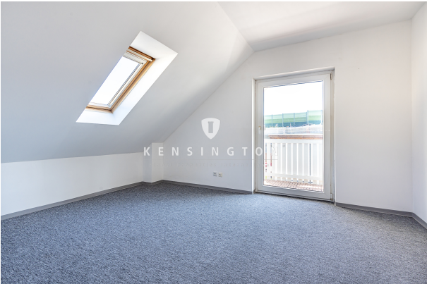
Schlafzimmer I WE1