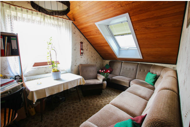
Zimmer 3 - OG