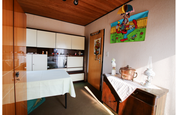
*Zimmer 2 - OG