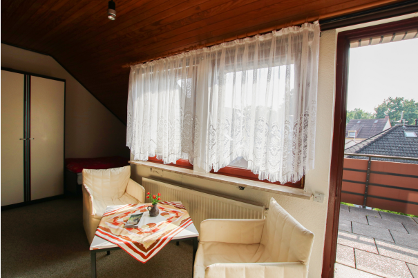
Zimmer 1 - OG