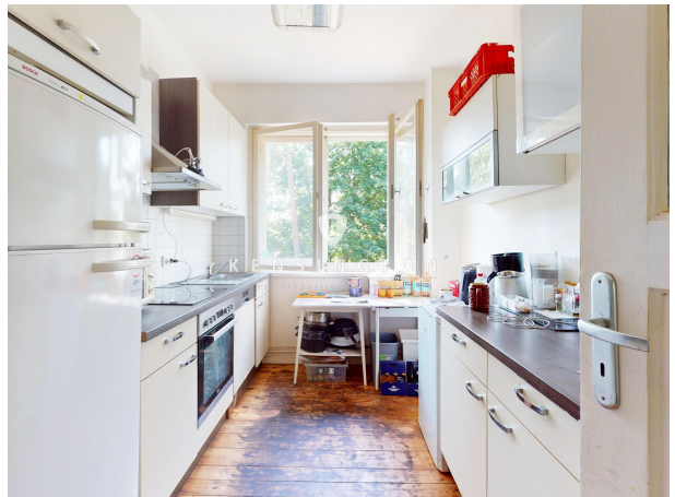
Küche 1. OG rechts