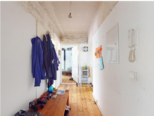
Flur 1. OG rechts