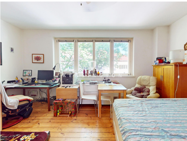
Wohnzimmer 1. OG rechts