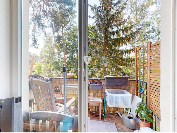
Balkon 1. OG rechts