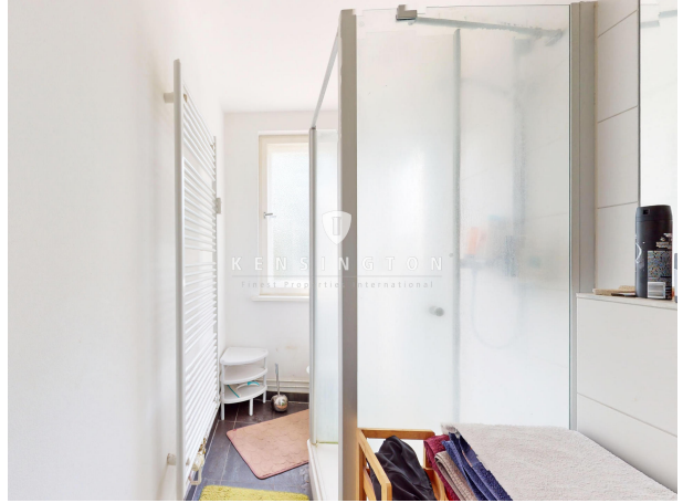
Duschbad 1. OG rechts