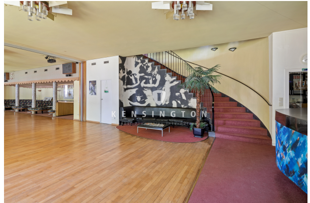
Treppe im Abrissgebäude