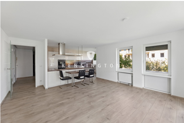
Wohnzimmer mit Küche