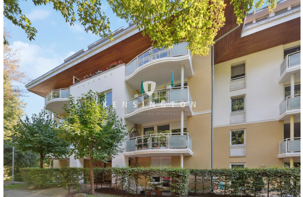
Haus von vorne