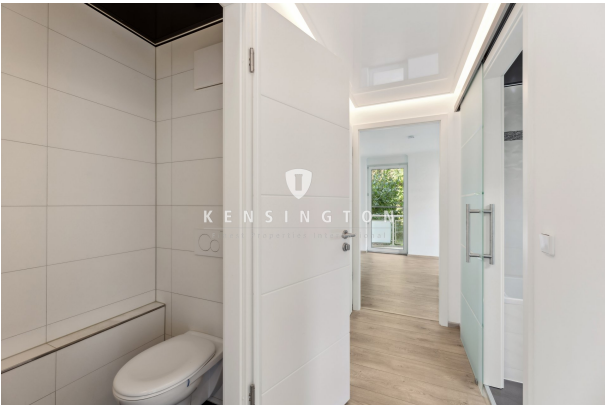
Gäste-WC mit Flur