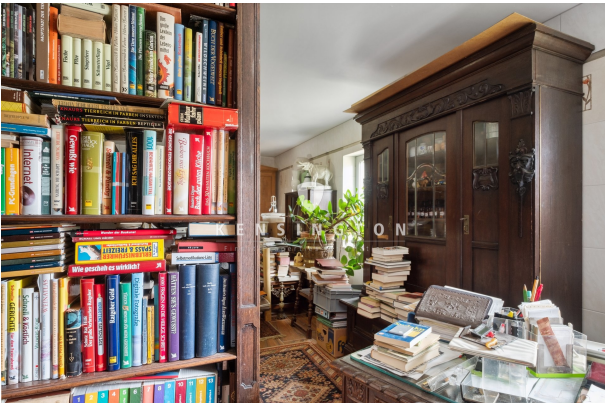
Wohnzimmer mit Bibliothek