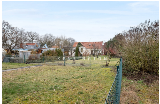
Blick in die Nachbargärten