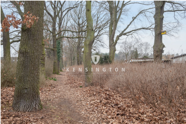
Gartenanlage vor der Siedlung