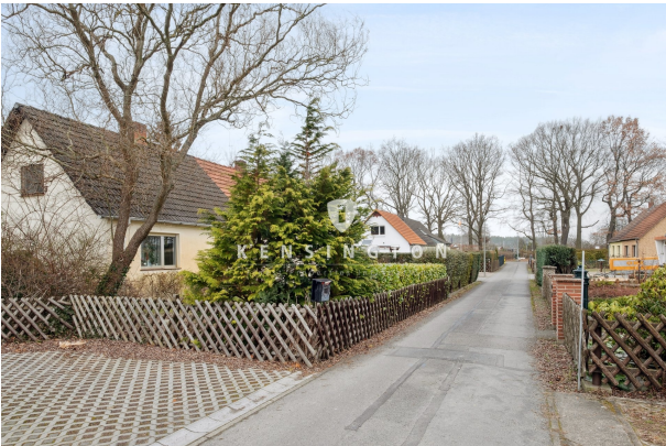
Blick in die Siedlung