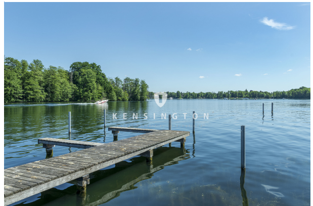
Blick auf Steg