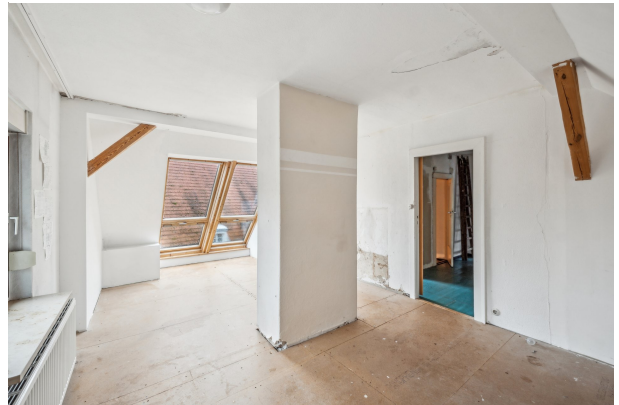
Zimmer im DG