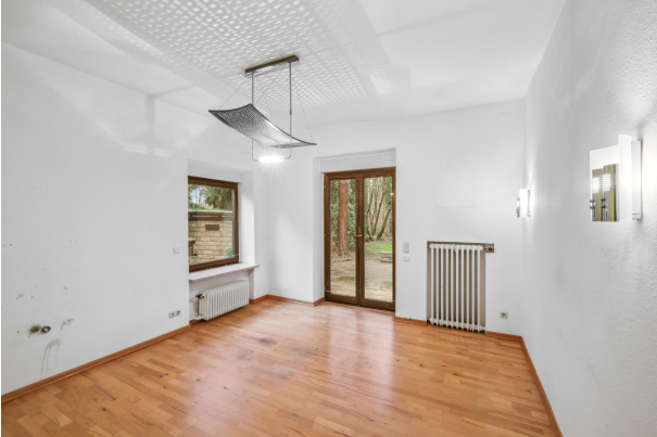
Zimmer im EG