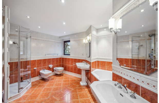
Bad im 1. OG