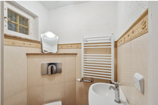
Gäste-WC im EG