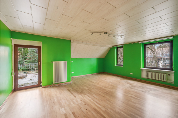
Schlafzimmer im 1. OG