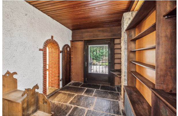
Büro im EG