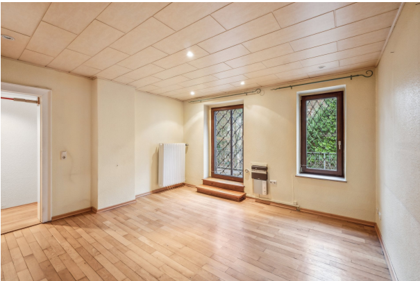
Kinderzimmer im 1. OG