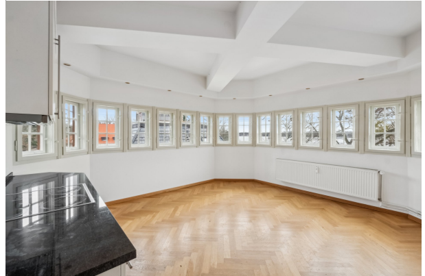
Küche mit Essbereich im Turmzimmer