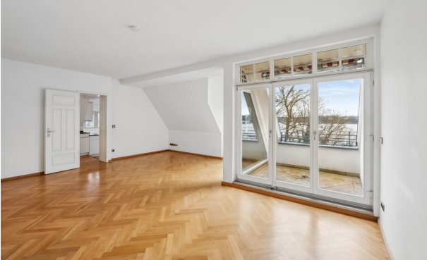
Wohnzimmer mit Balkon und Blick auf den großen Wannsee