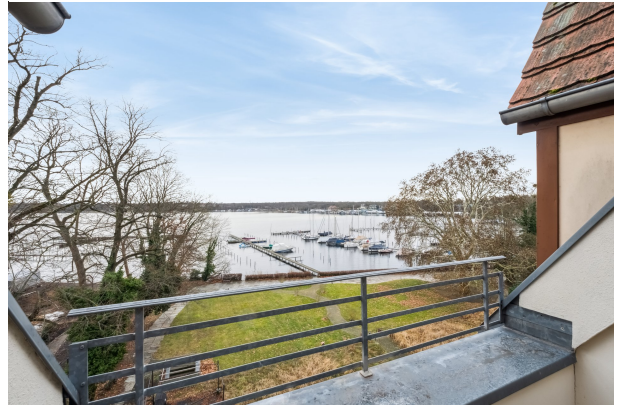
Balkon und Blick auf den großen Wannsee