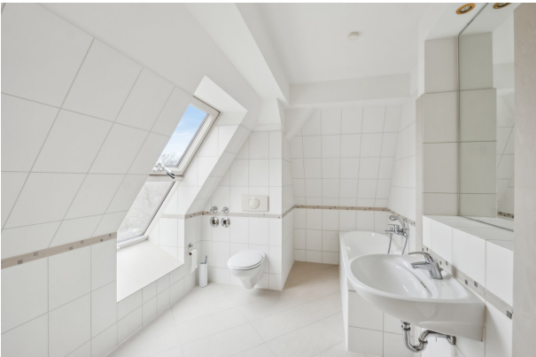
Bad in der oberen Etage