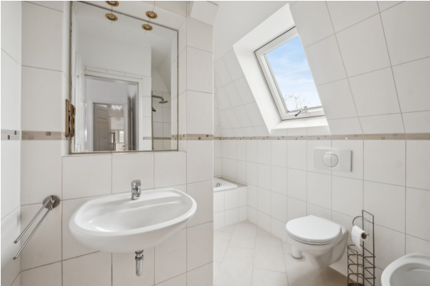
Bad mit Wanne und Dusche in der unteren Etage