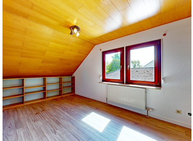
Zimmer 1 OG