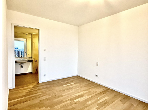
Schlafzimmer mit Bad en Suite