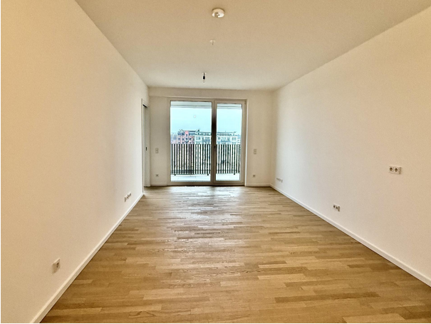
Wohnraum mit Blick auf die Spree