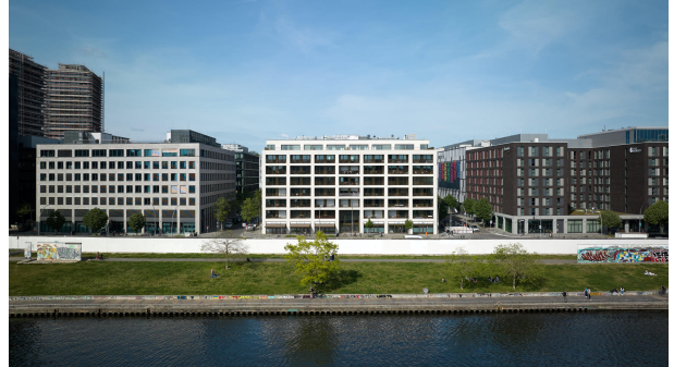
PURE-Living in Traumlage von Berlin