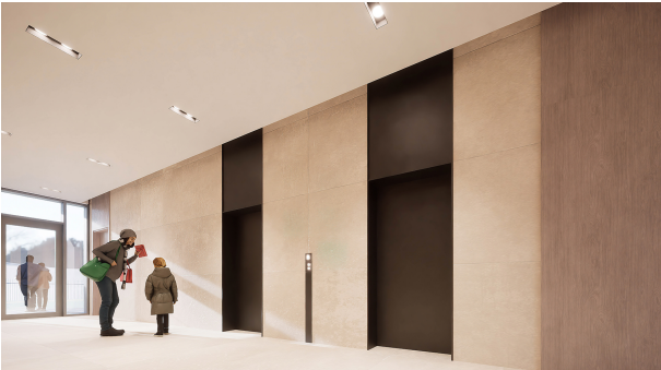
H101-Madrid Lobby v7 02