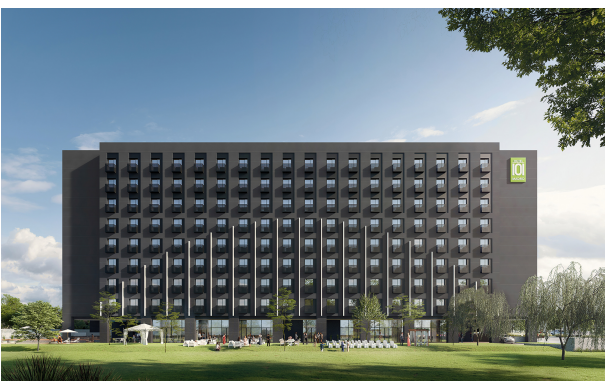
H101-Madrid Exterior Facade v2 02