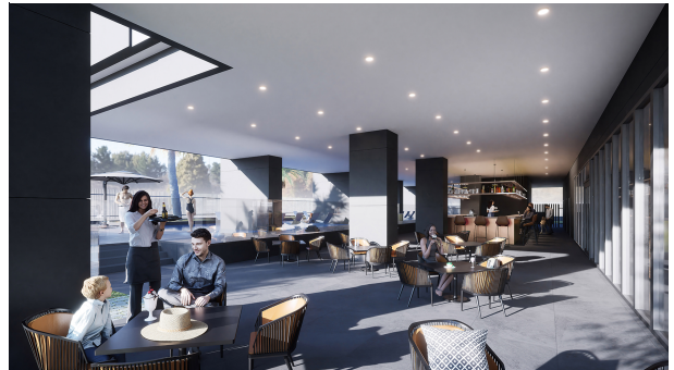
H101-Madrid Pool Bar v2 02