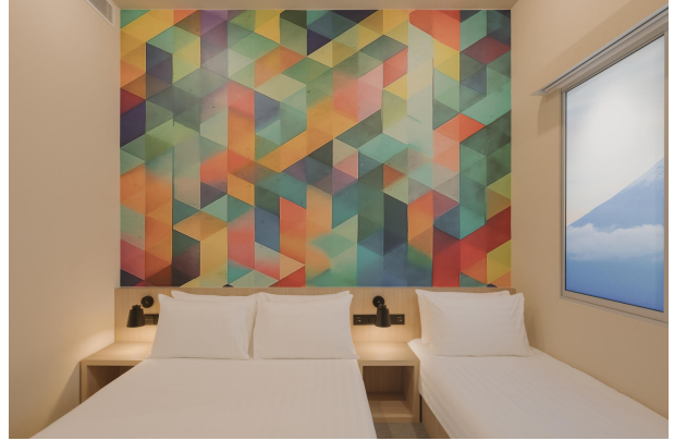
Hotel101 Showroom (Bedroom, v3)