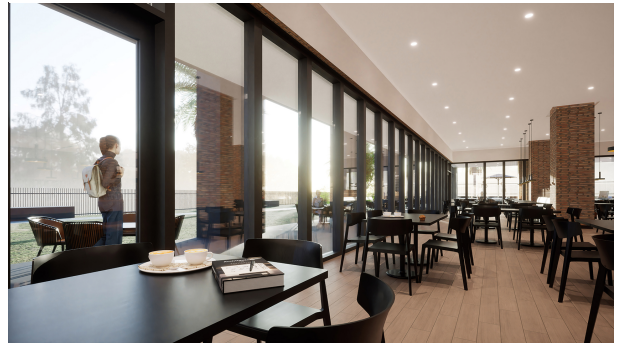
H101-Madrid Restaurant Comedor v3 02