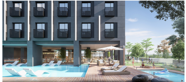
H101-Madrid OutdoorPool v1 02