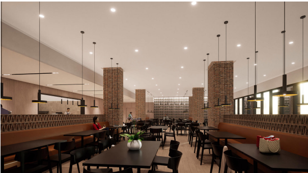
H101-Madrid Restaurant Comedor v2 02