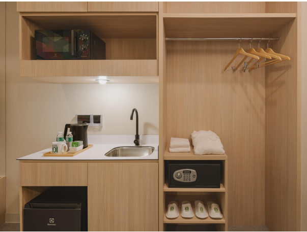
Hotel101 Showroom (Walkway)