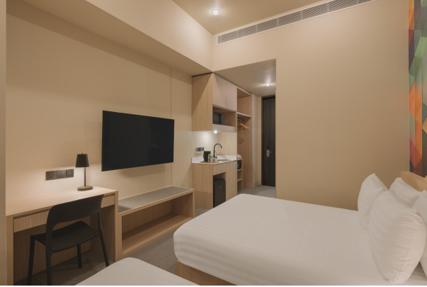
Hotel101 Showroom (Bedroom, v2)