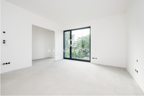
Visualisierung Hauptschlafzimmer mit Umkleideraum im 1. OG