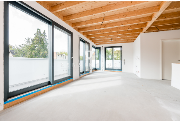
Visualisierung Wohn- und Essbereich im DG