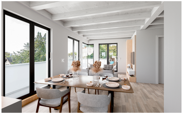
Wohnzimmer und Küchenbereich im DG