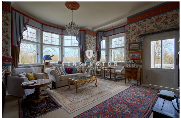
Wohnraum im OG mit Zugang zur Terrasse