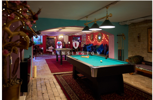
Hobbyparadies im Keller