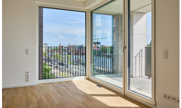
Spektakulärer Blick mit Zugang zu einer der beiden Terrassen