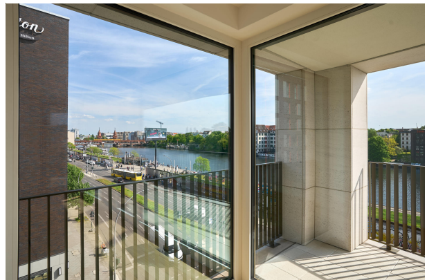
Spektakulärer Blick auf East Side Gallery und Spree