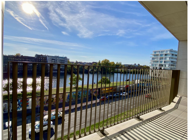
Zwei traumhafte Terrassen